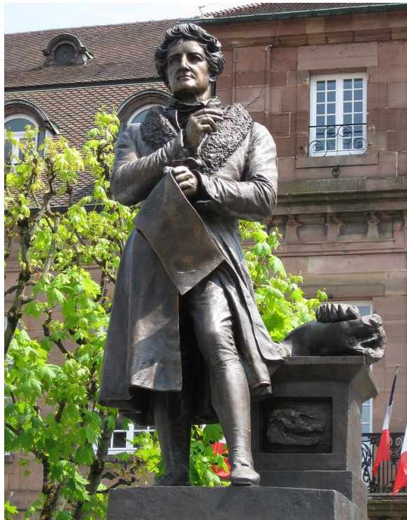
Figure 2 : statue de Georges Cuvier à Montbéliard.

Les cérémonies d'éloges au sein des académies se déroulent désormais au XIX e siècle sur les places publiques et se banalisent. En témoignent les nombreuses rondes-bosses qui ornent les