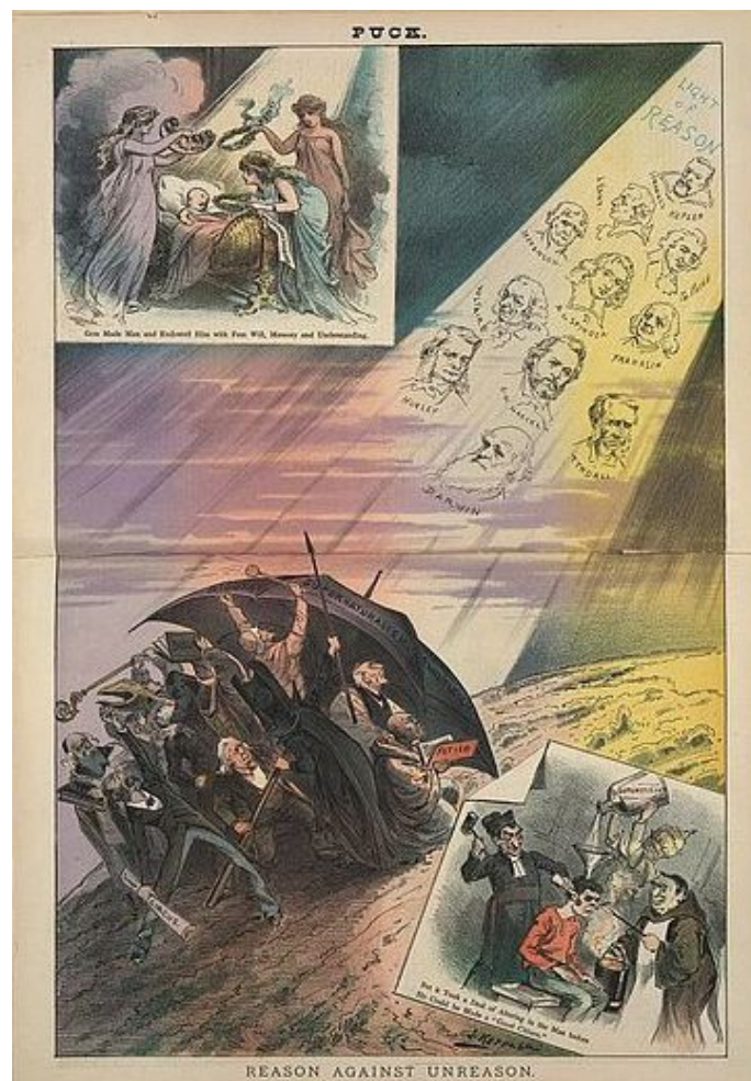
Figure 3 : « Reason against unreason » avec les portraits de Kepler, Kant, Paine, Jefferson, Spinoza, Franklin, Voltaire, Haeckel, Tyndall, Huxley et Darwin. Illustration de : J. Keppler, Puck , v. 11, n° 261, 8 mars 1882, Library of Congress, domaine public.

Enfin certains, comme Félix Jeantet, jouent sur le vocabulaire des croyances et parodient les prières chrétiennes. En 1887, dans son poème Croquis d'après nature , qu'il situe au Jardin des Plantes de Paris, il confronte l'homme aux singes enfermés et conclut ainsi :