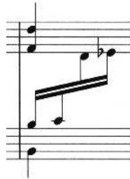
Figure 18: F. Bianchini, Est-il regret , CNRS Editions (V. Otéro)

le bas ont alors la tête à droite de celle-ci, tandis que les notes avec hampe vers le haut l'ont à gauche. Afin de garder un espace entre tête de note à peu près constant et permettre ainsi une bonne lecture, il convient de raccourcir le lien entre les notes au changement de portée, dans le cas d'une voix montant vers la portée supérieure. On réduit ainsi la distance horizontale entre les hampes, mais les têtes de notes sont régulièrement espacées.