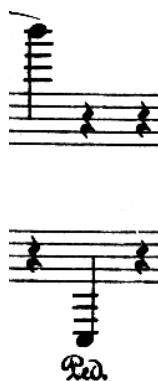
Figure 10: S. Prokofieff, Visions fugitives Op.22 , Ed. Booseys & Hawkes

Dans la musique à une seule voix, la hampe d'une note isolée est longue d'une octave, sauf en cas de lignes supplémentaires si la queue de la hampe n'atteint pas la première ligne supplémentaire : dans ce cas, la hampe doit toujours atteindre la ligne médiane.