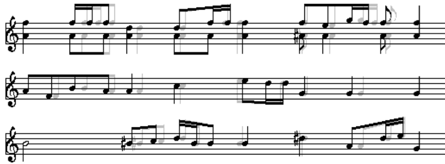
Figure 20: Comparaison de la saisie et de la justification automatique

Cet algorithme a été implémenté en Java et intégré à un éditeur distribué développé antérieurement [6]. Ces performances permettent de demander la justification de chaque ligne saisie et de voir immédiatement le résultat. La figure ci-dessous montre en grisé les signes disposés lors de la saisie, et en noir le résultat de la justification après validation de l'entrée.