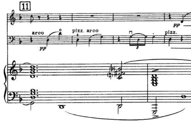
Figure 16: M. Ravel, Trio pour Piano, Violon et Violoncelle , op. cit.

Quant aux petites notes, elles se placent généralement avant le temps, et entraînent un décalage sur toutes les portées. Il en est de même pour les altérations en début de mesure, ou si par manque de place, l'espace entre notes est rallongé sur une portée, il doit l'être aussi sur les autres. On suppose de toutes façons qu'il existe une partition séparée pour chaque instrument, justifiée différemment de la partie du conducteur.