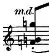
Figure 8: C. Debussy, Préludes, La terrasse des audiences du clair de lune , Ed. Durand