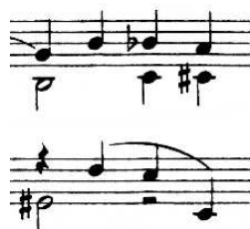
Figure 12: S. Prokofieff, Visions fugitives Op.22, Ed. Booseys & Hawkes

Dans la musique polyphonique, le sens des hampes permet de différencier les voix. Les règles précédentes ne s'appliquent plus : la longueur des hampes en particulier est souvent diminuée.