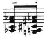
Figure 7: C. Debussy, Études , Pour les accords , Ed. Durand