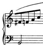
Figure 14: S. Prokofiev, Visions fugitives Op.22, Ed. Booseys & Hawkes

Le passage à la ligne s'effectue si possible après une barre de mesure. Cependant, des mesures exceptionnellement longues obligent à couper au milieu d'une mesure, voire sous un lien.