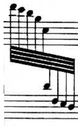
Figure 19: C. Debussy, Préludes, Feux d'artifice , Ed. Durand

Si au contraire une voix descend vers la portée inférieure, on essaiera de garder un espace constant entre les hampes, en rapprochant les têtes.