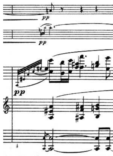
Figure 17: M. Ravel, Trio pour Piano, Violon et Violoncelle , op. cit.

Quant aux petites notes, elles se placent généralement avant le temps, et entraînent un décalage sur toutes les portées. Il en est de même pour les altérations en début de mesure, ou si par manque de place, l'espace entre notes est rallongé sur une portée, il doit l'être aussi sur les autres. On suppose de toutes façons qu'il existe une partition séparée pour chaque instrument, justifiée différemment de la partie du conducteur.