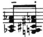
Figure 7: C. Debussy, Études , Pour les accords , Ed. Durand