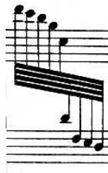
Figure 19: C. Debussy, Préludes, Feux d'artifice , Ed. Durand

Si au contraire une voix descend vers la portée inférieure, on essaiera de garder un espace constant entre les hampes, en rapprochant les têtes.