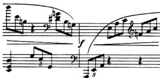
Figure 1: Changement de clef (M. Ravel, Trio pour Piano, Violon et Violoncelle , Master Music Publications, Inc)

En début de ligne, la clef se place à une dent du bord . Pour un changement de clef à l'intérieur de la pièce, les règles sont flexibles. Si la note précédant le changement est une valeur longue, on place la clé sur le grand espace qui suit cette note habituellement. Si c'est une valeur courte, il faudra décaler les autres portées du système pour conserver la synchronisation des voix.