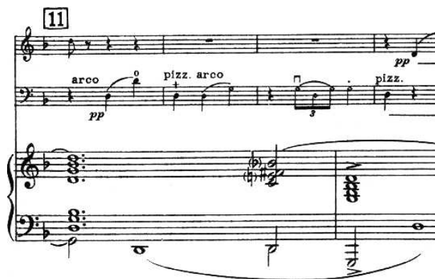
Figure 16: M. Ravel, Trio pour Piano, Violon et Violoncelle , op. cit.

Quant aux petites notes, elles se placent généralement avant le temps, et entraînent un décalage sur toutes les portées. Il en est de même pour les altérations en début de mesure, ou si par manque de place, l'espace entre notes est rallongé sur une portée, il doit l'être aussi sur les autres. On suppose de toutes façons qu'il existe une partition séparée pour chaque instrument, justifiée différemment de la partie du conducteur.