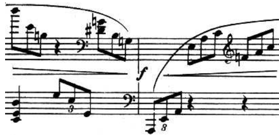
Figure 1: Changement de clef (M. Ravel, Trio pour Piano, Violon et Violoncelle , Master Music Publications, Inc)

En début de ligne, la clef se place à une dent du bord . Pour un changement de clef à l'intérieur de la pièce, les règles sont flexibles. Si la note précédant le changement est une valeur longue, on place la clé sur le grand espace qui suit cette note habituellement. Si c'est une valeur courte, il faudra décaler les autres portées du système pour conserver la synchronisation des voix.