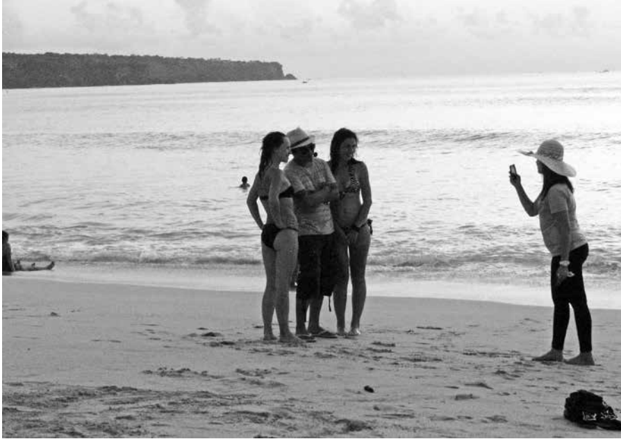
Illustration 2. – Touristes indonésiens se faisant prendre en photo avec des touristes caucasiens sur la plage. Dreambeach. S. Pickel Chevalier, 2013.

liser par des photos souvenirs, notamment en suivant la mode très en vogue du « selfie », et si possible avec des touristes caucasiens appelés « bules » (questionnaires 2011-2013; observations été 2011, 2012 et 2013).