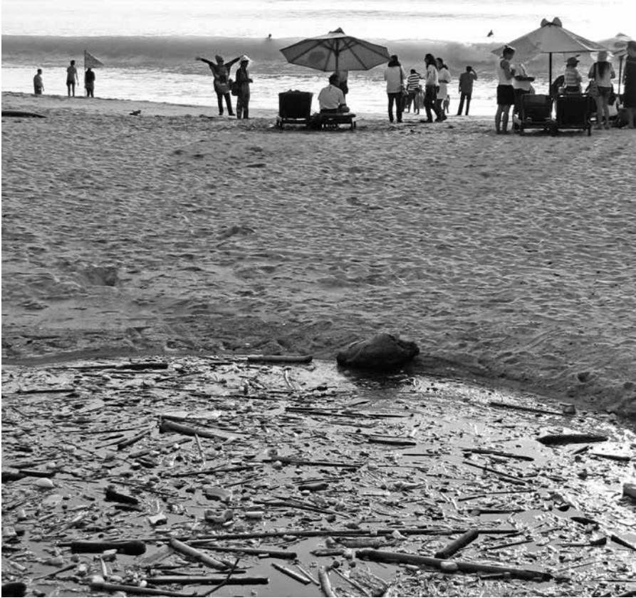
Illustration 3. – Un management environnemental insuffisant provoque d'importantes pollutions. Dreambeach, S. Pickel Chevalier, 2013.