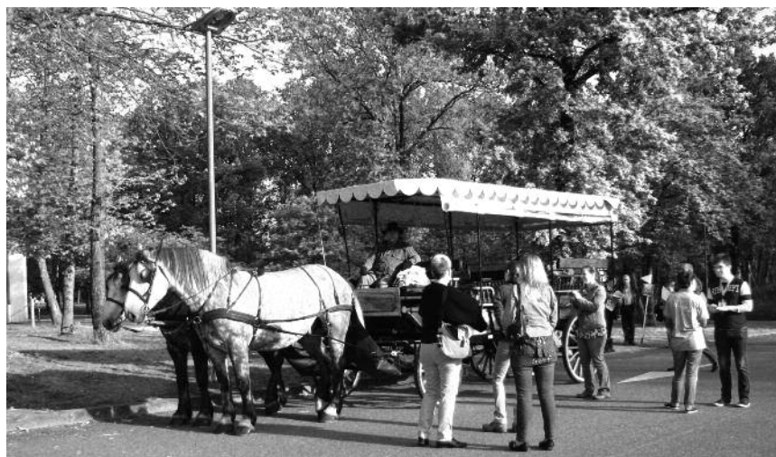
Illustration 2 • Calèche proposant des visites touristiques de Saumur (souvent la seule "apparition" de chevaux dans la ville)