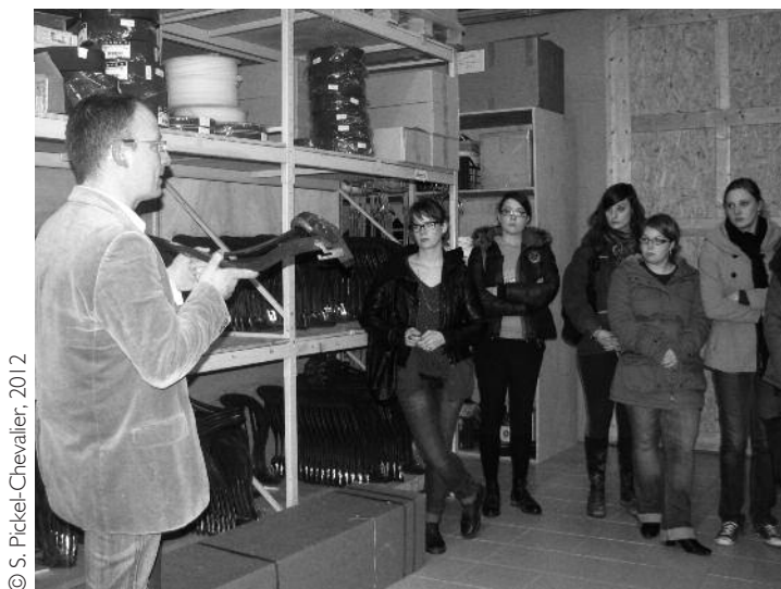
Illustration 1 • Visite de la sellerie Butet par les étudiants de licence "Commercialisation des produits équins"