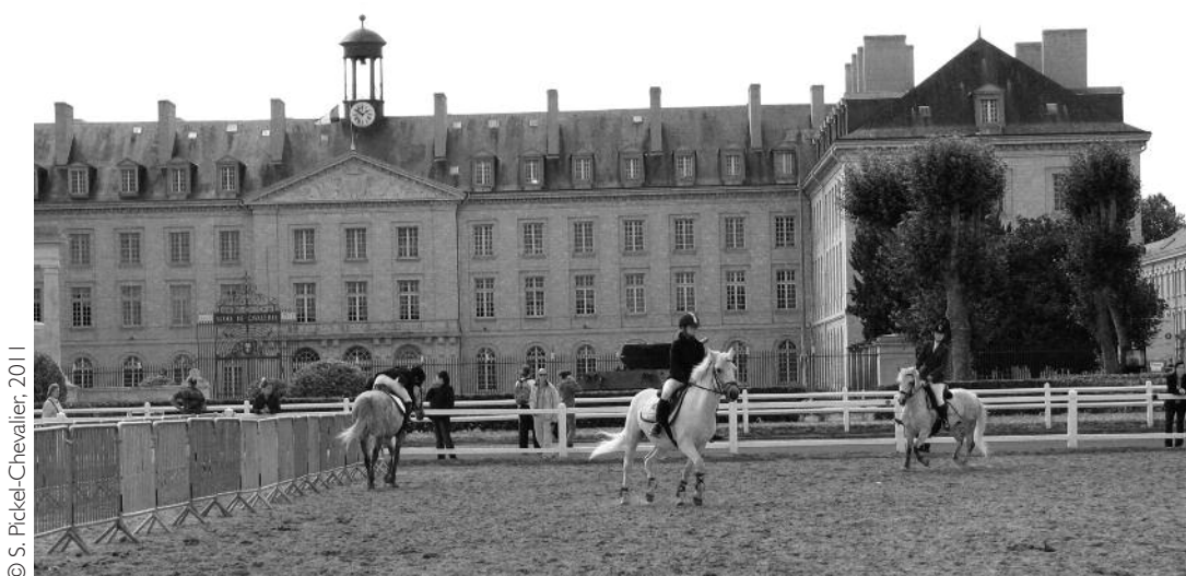
Illustration 4 • Participation de l'École de cavalerie aux Saumuriades, en septembre 2011, par l'organisation d'un concours Ponam