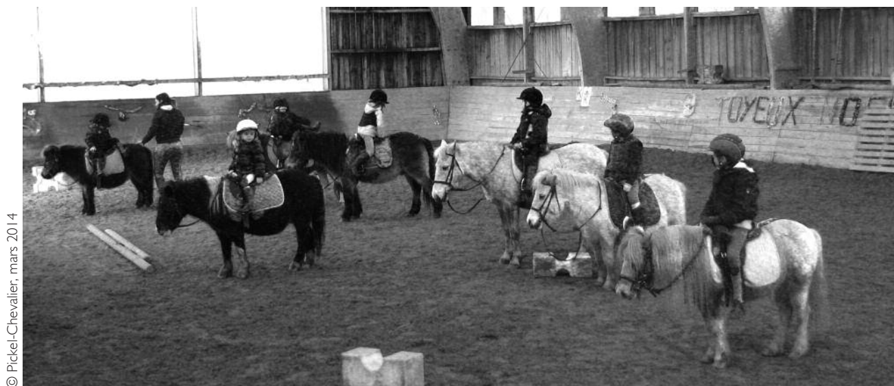
Illustration 2 • Cours pour les 4 à 6 ans, associant pédagogie et jeux sur une cavalerie adaptée (centre équestre de Charente-Maritime)