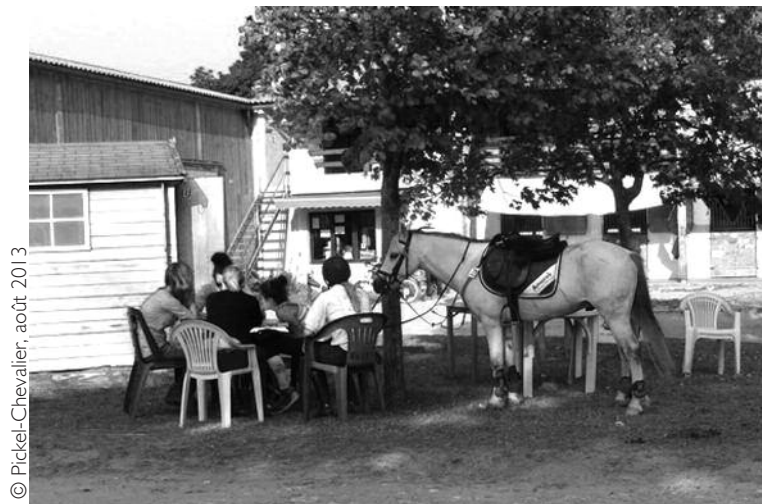
Illustration 4 • Le centre équestre, lieu de sociabilité intégrant, parfois malgré lui, le cheval...

je faisais mal, mon instructeur me jetait des cailloux. Pour mon fils aujourd’hui, le rapport est bien différent avec son moniteur qui sait le motiver ”, confie une cavalière d’Ille-et-Vilaine (entretien, mars 2014). Répondre au besoin d’expériences plus variées, éviter que les cavaliers ne “se fassent peur”, leur faire vivre un “bon moment”, tels sont les nouveaux objectifs de ces enseignants, qui doivent savoir être conviviaux, tout en maintenant la distance quand la rigueur de l’exercice doit l’emporter pour assurer la sécurité du cavalier et du cheval. Les compétences du moniteur ont donc dû évoluer vers celles de l’animateur : il doit savoir concilier la transmission des techniques équestres avec une forme de convivialité, et surtout de talent, pour capter l’intérêt des publics qu’il convient désormais de “séduire”.