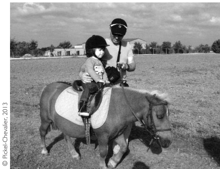
Illustration 3 • Organisation de baby-poney : initiation pour les enfants de 4 ans et moins, en mettant les parents à contribution

La diversification des profils, des attentes et des pratiques engendre aussi un problème central de cohabitation au sein des structures. En dépit de la passion commune pour l’équitation, les catégories de clients témoignent de comportements mais aussi de relations au cheval très variées (Pickel-Chevalier et Grefe, 2014), qui tendent à en faire les