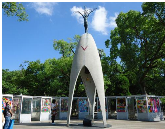
Figura 1 – Monumento da paz das crianças.