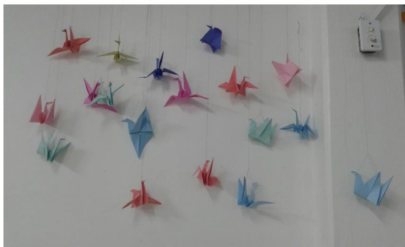
Figura 3 – Tsurus .