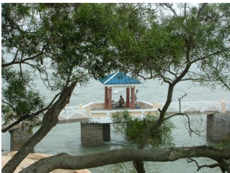
Figure 3. L'aménagement des sites sur les littoraux ne nuit pas à leur caractère naturel pour les Chinois. Il favorise leur intégration en les rendant accessibles et sécurisés. La promenade suspendue à Xiamen permet, comme à Biarritz, de profiter du spectacle de l'océan sans danger.

l'UNESCO, est doté d'un imposant escalier taillé dans la roche, orné de nombreuses portes monumentales, jalonnant son ascension. Cette anthropisation ne fait pas perdre au milieu son caractère « naturel » dans la conscience collective chinoise 9 . Les individus viennent rechercher l'émotion d'une ascension spectaculaire, au travers d'un parcours sécurisé. Il en est de même pour le parc de la célèbre station thermale de Bishuiwan (bourg de Conghua, au nord-est de Canton). Ce dernier, étendu sur seulement 4 ha, est promu comme un lieu naturel, comme en témoigne la présentation même du parc, indiquant, sur une stèle monumentale à l'entrée, que l'aspect sauvage ( ye ) est une de ses principales caractéristiques (Taunay et Violier, 2011). Les touristes recherchent bien le contact avec la nature, laquelle est pourtant largement domestiquée au travers des chemins dallés qui la sillonnent. Les toponymes du parc nous indiquent aussi une vision poétique de l'environnement, qui montre la relation intrinsèque dans la conscience collective, entre nature et culture : la vallée des papillons et des orchidées, la vallée du lever de soleil sur les terrasses, etc. Un espace naturel peut donc être « très » aménagé, dans une même recherche d'accessibilité et de sécurité, comme l'illustrent aussi les parcs naturels de la ville de Xiamen, proposant des promenades suspendues au-dessus de la mer, qui ne sont pas sans rappeler les installations de Biarritz.... (Figure 3).