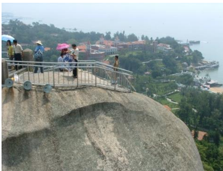
Figure 4. Point de vue très touristique de l'île de Gu Lang YU : le site est aménagé pour assurer la sécurité des touristes et pourvu de nombreux haut-parleurs, diffusant de l'information dans une ambiance très animée.