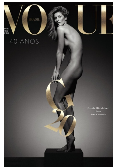
Figura 3: A modelo Gisele Bündchen na capa da revista Vogue Brasil, maio/2015

Se à primeira vista as duas revistas parecem assumir perspectivas editoriais divergentes, um olhar mais atento permite identificar, nas duas publicações, uma repetição de assuntos que reforçam os padrões normativos estéticos e de comportamentos femininos. Ao lado de editoriais que remetem a um rompimento com esses padrões, como “Love-se: em um mundo cada vez mais plural, aceitar-se é o novo preto” (p. 184), “Bonito é ser diferente: dê as boas-vindas a toda forma de beleza” (p. 188) e “Garota Rebelde: Rebel Wilson une diversão e empoderamento feminino” (p. 194); Elle também reproduziu conteúdos muito semelhantes à sua concorrente e ao que usualmente é pauta em suas edições: “Atualize seu look : turbine o closet de inverno” (p. 304), “Modos de usar: sexy sem ser perigete? Sim, é possível” (p. 312), “Elas: o fotógrafo Bob Wolfenson fala sobre a magia das supermodels” (p. 238).