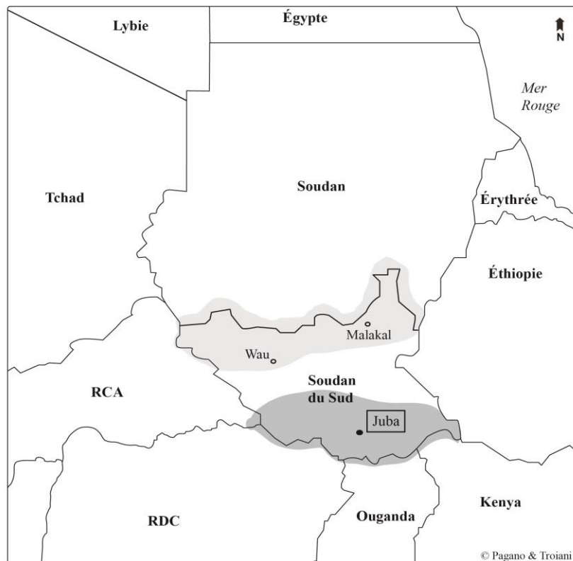
Carte 1. Aire de diffusion de l'arabe de Juba

politique linguistique, développé en réaction à la politique d'arabisation imposée par le gouvernement de l'ex-Soudan unifié, favorise un processus de tribalisation de l'État sur une base ethnolinguistique. Ainsi, elle ne reconnaît pas l'existence de l'AJ comme « langue autochtone » principalement en raison de son rôle de moyen de communication interethnique. C'est pour cette raison qu'à ce jour l'AJ ne fait l'objet d'aucune planification linguistique par l'État.