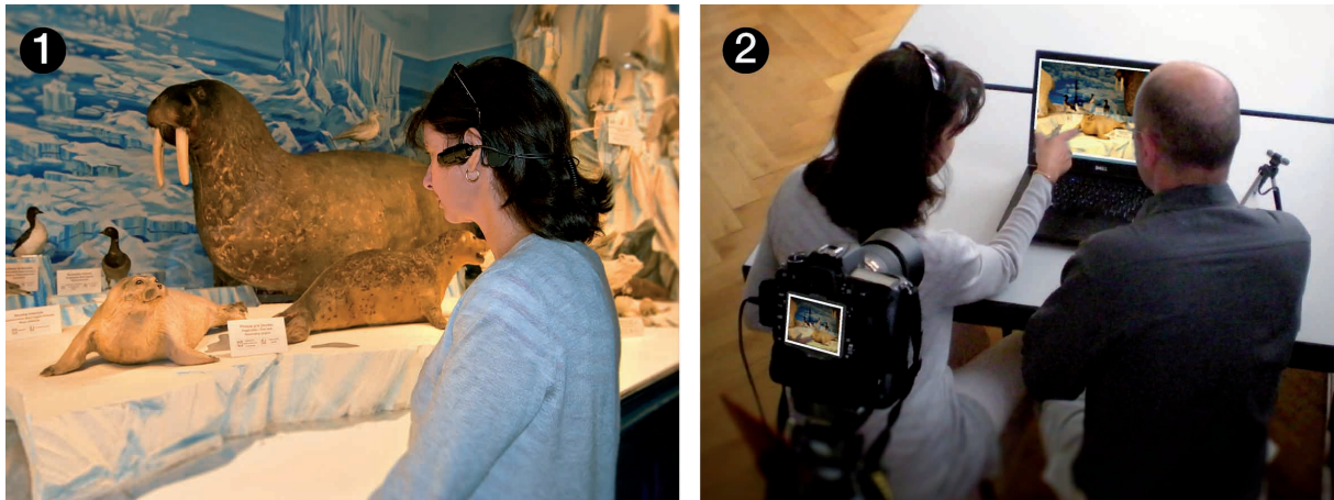
Figure 1. Les entretiens réalisés en re-situ subjectif ❶ Les visiteurs sont équipés d'une caméra miniature puis laissés à leur visite naturelle. ❷ A l'issue de leur visite, les personnes sont invitées à décrire leur expérience à partir de l'enregistrement vidéo de leur perspective visuelle tandis qu'une caméra placée derrière elles enregistre la vidéo subjective, cette fois avec les commentaires et les gestes du visiteur.

A l'issue d'un temps de visite d'environ 30 à 40 minutes, nous déséquiperons les visiteurs et les installons dans une pièce à l'écart du public où nous leur diffusons leur propre vidéo subjective. A partir de l'enregistrement de la trace de leur activité, nous leur demandons de décrire leur expérience. Ces descriptions ne sont pas l'expérience elle-même, mais nous pouvons considérer ces verbalisations comme des verbalisations préreflexives qui rendent compte de l'effet de surface du couplage de l'acteur avec l'environnement tel qu'il l'a vécu (Theureau, 2010 : 291). Nous pouvons aussi considérer ces verbalisations comme des descriptions symboliques acceptables du domaine cognitif du visiteur (Varela, 1989 : 183 ; Theureau, 2006 : 41). Lors de l'entretien en re-situ subjectif les visiteurs découpent spontanément la trace vidéo de leur activité en unités signifiantes. Chaque unité signifiante de l'activité peut être considérée comme la manifestation d'un signe qui comporte six composantes (Theureau, 2006 : 286) :