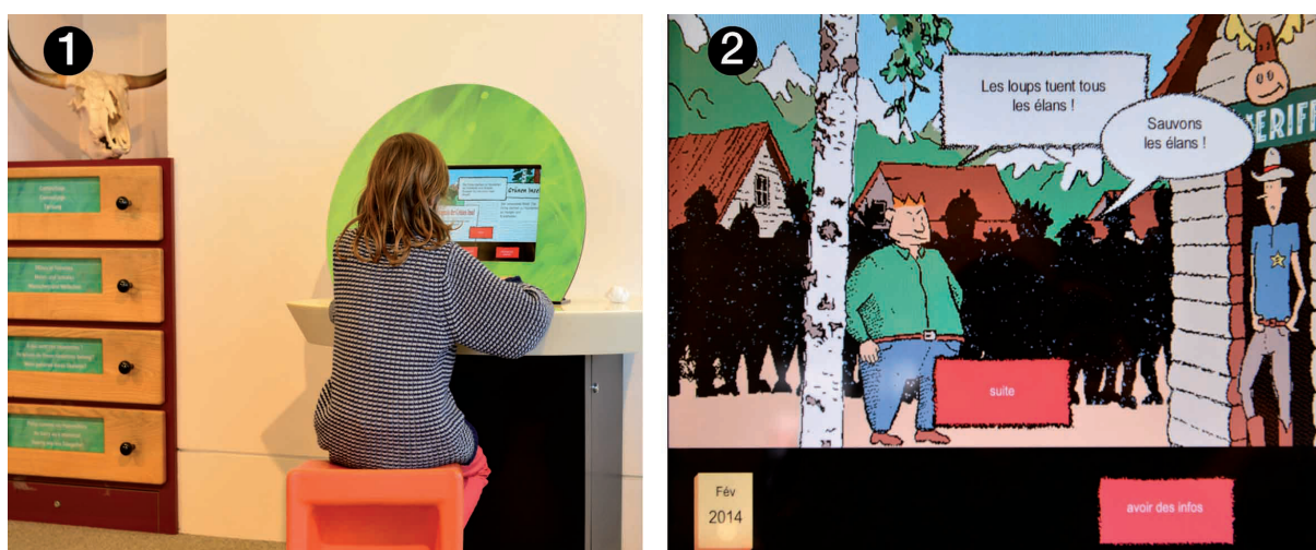
Figure 2. ❶ Le jeu Proies et Prédateurs dans l'espace Animaux s'inspire de la situation scolaire écran-livre, table, chaise. ❷ L'écran est tactile et les pages numériques se succèdent comme les pages d'un livre.

Les outils numériques de médiation proposés par les centres de culture scientifique se matérialisent sous différentes formes : écrans, dispositifs hybrides, réalité augmentée, immersion, etc. Nous en avons retenu deux, différents au premier abord, mais qui organisent des interactions similaires. Le premier, Proies et Prédateurs est un jeu multimédia où toutes les interactions des visiteurs se déploient à la surface d'un écran. L'écran d'accueil indique « Tu es le shérif de l'île. Les loups tuent tous les élans. Les habitants sont mécontents. Tu risques de ne pas être réélu shérif. Que vas-tu faire ? » L'enjeu consiste à prendre les bonnes décisions pour réguler l'équilibre entre des loups et des élans afin de contenter la population et être réélu shérif de l'île. Des informations sur les loups, les élans et l'équilibre entre les loups et élans sont disponibles dans le cours du jeu.