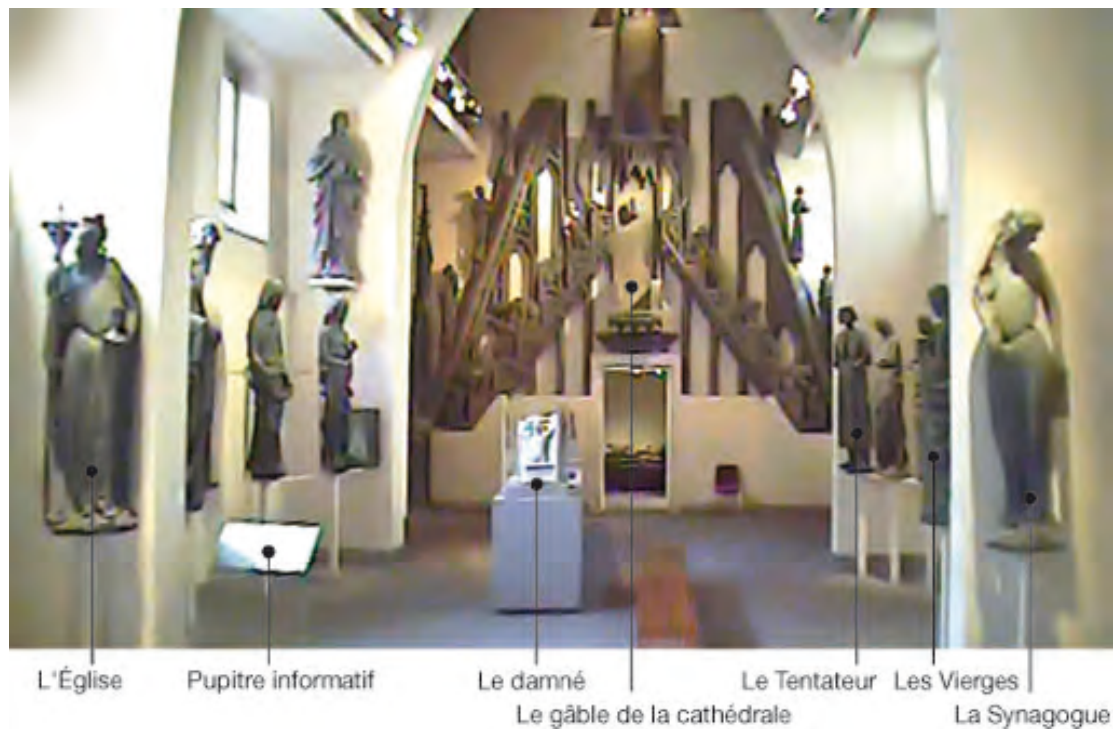
Figure 2. Perspective de la salle dite du jubé au musée de l'Œuvre Notre-Dame à Strasbourg telle qu'on la découvre dans le sens de la visite. « Je me suis sentie tout de suite un peu dans une... une cathédrale-église, pourtant je ne déteste de loin pas ça [...] c'est pas mortifère comme la plupart du temps, mais ce truc là [...] ce gros truc au fond là, il est imposant... voilà je sais pas trop quoi en faire du... j'ai pas lu encore, j'ai rien lu » [Annie SH2].