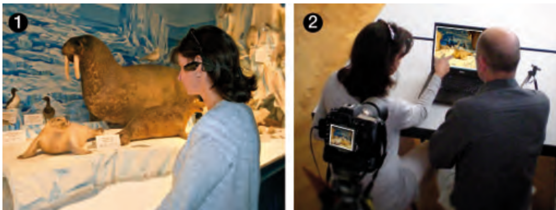
Figure 1. ❶ Les visiteurs sont équipés d'une mini-caméra et d'un micro. Nous obtenons un film vidéo proche de leur perception visuelle naturelle. ❷ Les visiteurs sont ensuite invités à décrire leur expérience à partir de ce film. Une caméra placée derrière le visiteur et le chercheur enregistre l'écran vidéo, l'entretien et les gestes du visiteur. L'enregistrement obtenu est transcrit, les signes hexadiques sont renseignés, ce qui nous permet de reconstruire le cours d'expérience des visiteurs.

Ainsi, pour conserver une trace du monde perçu par le visiteur d'un musée ou d'une exposition, nous l'équiperons dans un premier temps d'une mini-caméra qui enregistre sa perspective subjective visuelle et auditive et nous le laissons librement évoluer sans la présence du chercheur 15 . À l'issue d'un temps de parcours d'environ 30 minutes, le visiteur est déséquipé, puis placé devant un écran vidéo, dans un lieu à l'écart de l'activité de visite. Sur cet écran, nous diffusons l'enregistrement vidéo subjectif du visiteur à partir duquel nous l'invitons à raconter et à commenter son expérience de visite. Une caméra, placée derrière le visiteur et le chercheur, enregistre cette fois l'entretien et leurs gestes devant l'écran. Lors de cet entretien appelé entretien en re-situ subjectif ou entretien RSS, le visiteur découpe spontanément son activité en unités significatives de son point de vue. Ses descriptions et ses commentaires sont d'autant plus précis que l'enregistrement vidéo est réalisé à partir de son point de vue et s'appuie sur sa réminiscence 16 . L'entretien RSS est ensuite transcrit et analysé à travers le cadre sémiologique de Theureau 17 . Nous identifions ce qui à chaque instant est pris en compte par le visiteur : ce qu'il regarde, ce qu'il fait, ses attentes, ses préoccupations, les savoirs mobilisés, afin de documenter chaque fragment de séquence significative, puis de reconstruire son cours d'expérience.