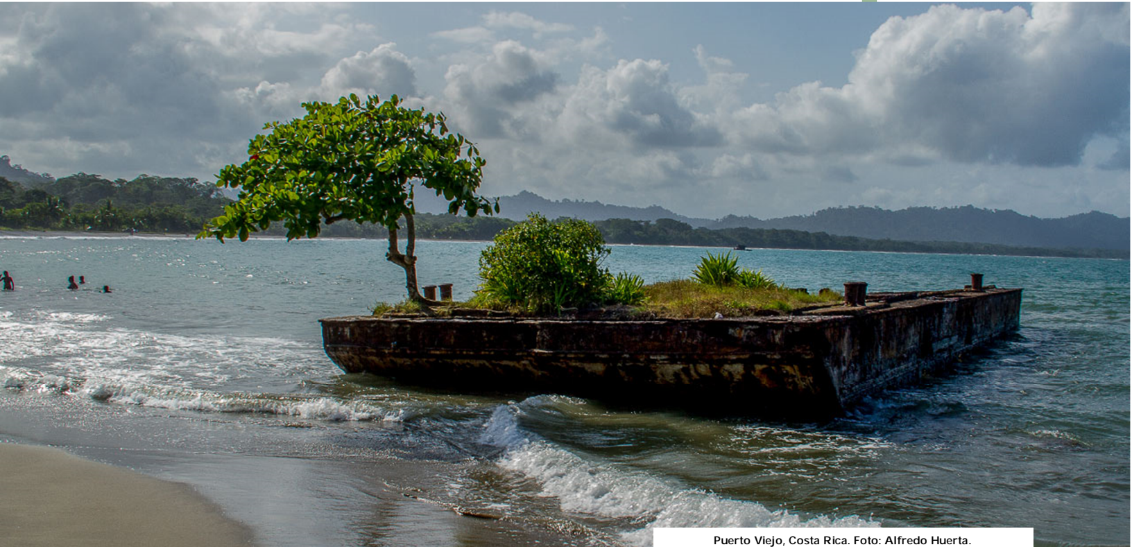
Puerto Viejo, Costa Rica.