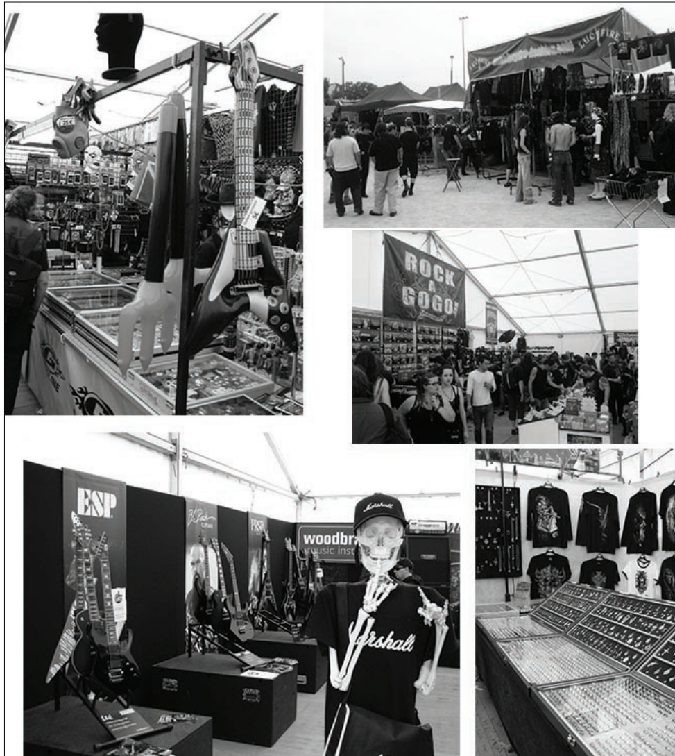
Figure 2 : L'« Extreme Market » : un espace marchand couvert et en plein air (photographies de l'auteur, 2010 et 2011).