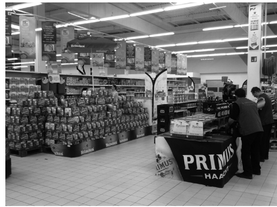
Figures 5 & 6 : Les usages différenciés d'un même espace marchand (photographies de l'auteur, juin 2010).