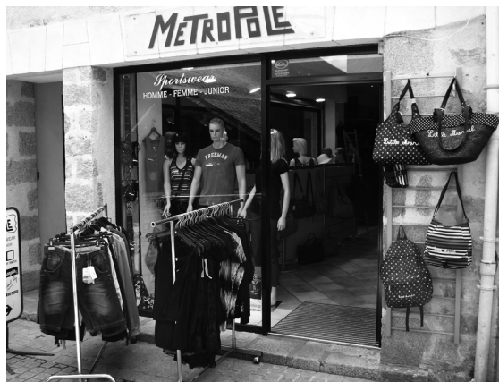
Figures 7 & 8 : Le centre-ville de Clisson aux couleurs du metal (juin 2013) Si les rues piétonnes de Clisson sont, pendant le festival, largement investies par les festivaliers, vêtus à la mode metal (couleur noire dominante), une part importante des magasins voient leurs vitrines modifiées au couleur de la musique metal, profitant d'une importante clientèle de passage.