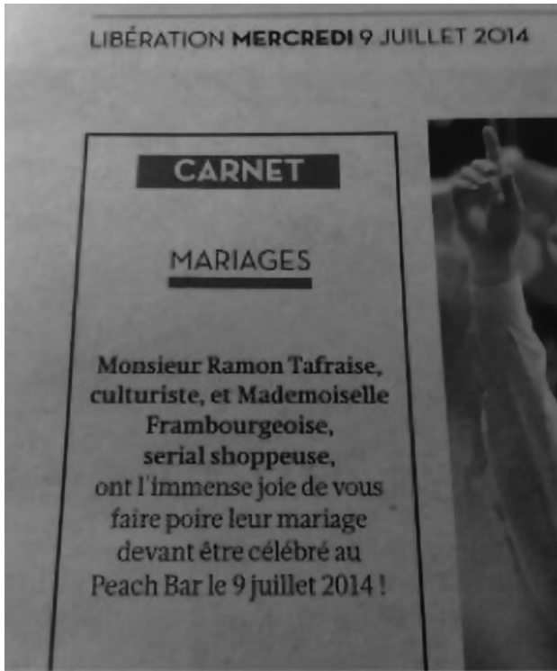
Figure 7 : Faire-part du mariage de Ramon Tafraïse et Frambourgeoise dans Libération .

Un dernier exemple de cette websérie qui démontre la « méta-clôture » et illustre une nouvelle fois l'abolition des frontières entre factuel et fictionnel.