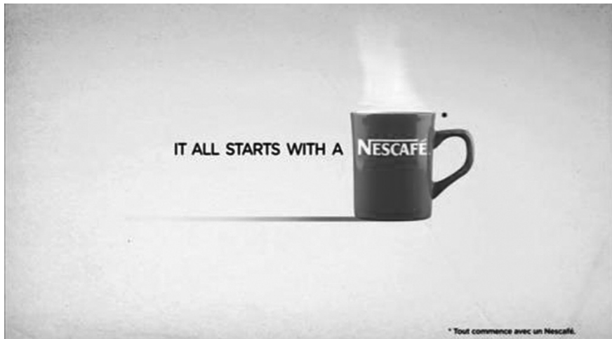
Figure 4 : It all starts with a Nescafé (signature de la marque).

Le mug Nescafé d'Arnaud, symbole de socialisation, constitue la transition entre ces deux univers.