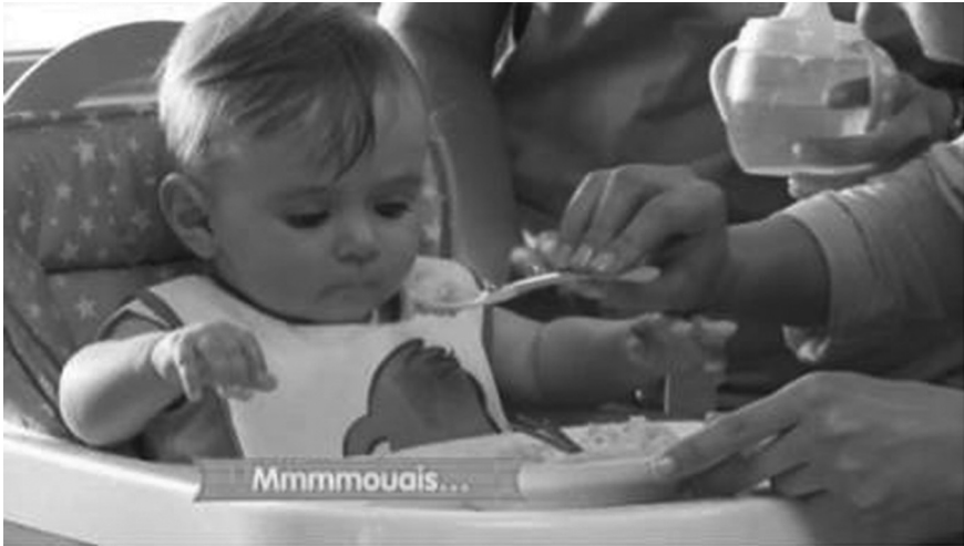
Figure 5 : Les bébés jugent la nourriture dans Les Parents Toqués de Nestlé Bébé.

La marque Nestlé Bébé pousse la logique hyperspectaculaire encore plus loin en proposant au public une émission culinaire sur le Web dont le sujet central est la cuisine pour les bébés : Les Parents Toqués . Au menu, des épreuves de 15 minutes (« Les grands plats dans les p'tits », « Le grand méchant goût », « Une pincée de goût »), le verdict des bébés et des conseils personnalisés pour tous les parents. En ce sens, on ne sort donc pas de l'univers premier de la marque. Ces webépisodes permettent de mieux comprendre les attentes des bébés, sans que le public ne se sente pour autant obligé d'acheter les petits pots Nestlé. « On ne vend plus tant le produit que l'expérience imaginaire que celui-ci génère » 44 , explique Nicolas Riou. Tous ces exemples semblent confirmer l'hypothèse d'une nouvelle logique de marque, davantage « hypermoderne », reposant sur une hybridation des genres et une esthétisation poussée. L'appropriation médiatique des marques est un autre aspect de la marque « hypermoderne » qu'il convient d'étudier plus en profondeur dans une dernière partie.