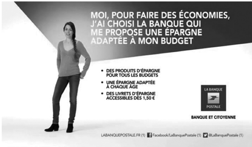
Figure 1 : Services de La Banque Postale proposés dans la websérie Comme le disent les gens .

généralement en cinq ou six actes (séparés les uns des autres par la coupure publicitaire), la websérie de Bouygues Télécom est de son côté composée de quatre parties : le générique, l'introduction (« Comme beaucoup de familles, les Dumas. . . »), la succession de situations et de gags incongrus autour d'un thème (vacances, jeux vidéo, sms, photos, vidéos, films, portables, réseaux sociaux, etc.) et la promesse commerciale. Il en est de même pour la websérie Comme le disent les gens de La Banque Postale, qui débute par un gag d'ouverture, suivi par l'annonce du titre correspondant au client visé (« Comme le disent. . . les économistes ») et d'un enchaînement de gags autour de cette cible avant de terminer sur les services de La Banque Postale : des produits d'épargne pour tous les budgets, une épargne adaptée à chaque âge, des livrets d'épargne accessibles dès 1,50 €. . . sans oublier son logo, son site Web, ainsi que ses liens Facebook et Twitter pour prolonger l'expérience numérique.