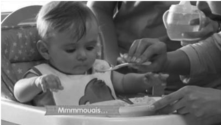
Figure 5 : Les bébés jugent la nourriture dans Les Parents Toqués de Nestlé Bébé.

La marque Nestlé Bébé pousse la logique hyperspectaculaire encore plus loin en proposant au public une émission culinaire sur le Web dont le sujet central est la cuisine pour les bébés : Les Parents Toqués . Au menu, des épreuves de 15 minutes (« Les grands plats dans les p'tits », « Le grand méchant goût », « Une pincée de goût »), le verdict des bébés et des conseils personnalisés pour tous les parents. En ce sens, on ne sort donc pas de l'univers premier de la marque. Ces webépisodes permettent de mieux comprendre les attentes des bébés, sans que le public ne se sente pour autant obligé d'acheter les petits pots Nestlé. « On ne vend plus tant le produit que l'expérience imaginaire que celui-ci génère » 44 , explique Nicolas Riou. Tous ces exemples semblent confirmer l'hypothèse d'une nouvelle logique de marque, davantage « hypermoderne », reposant sur une hybridation des genres et une esthétisation poussée. L'appropriation médiatique des marques est un autre aspect de la marque « hypermoderne » qu'il convient d'étudier plus en profondeur dans une dernière partie.