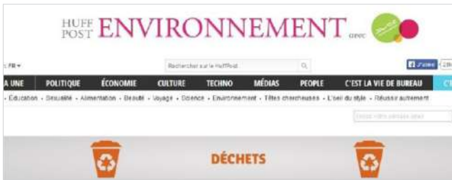
Figure 1 - Présence du logo de Suez Environnement à côté de la rubrique « Environnement » du Huffington Post

savoir « un produit publicitaire qui permet à l'annonceur de créer une rubrique sponsorisée au sein de l'arborescence du Huffington Post » 15 . En reprenant les éléments de la charte graphique du site, cette page de rubrique intègre aussi bien des infographies que des tribunes ou des interviews. Les articles de la marque se différencient donc pas du style et de la forme des contenus éditoriaux du Huffington Post .