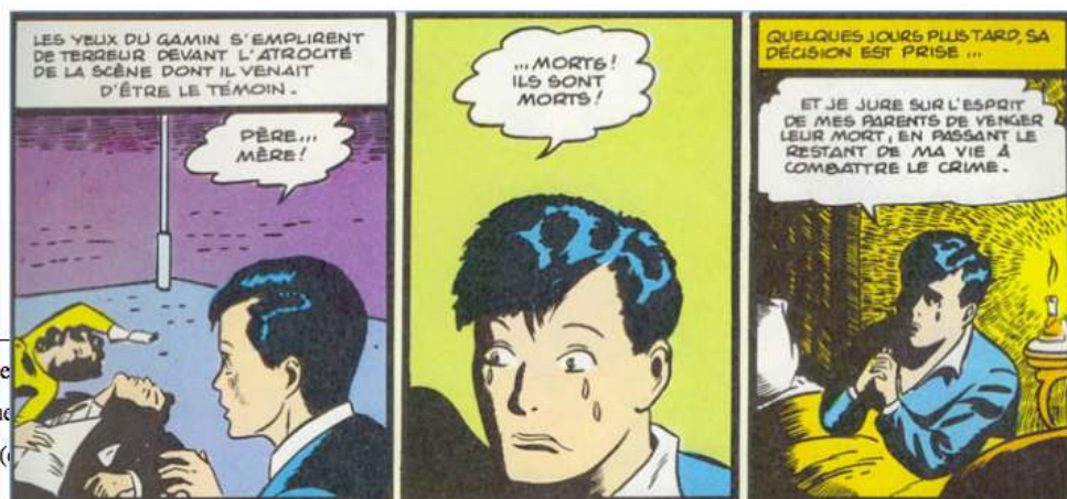
Illustration 1. Bruce Wayne assiste au meurtre de ses parents