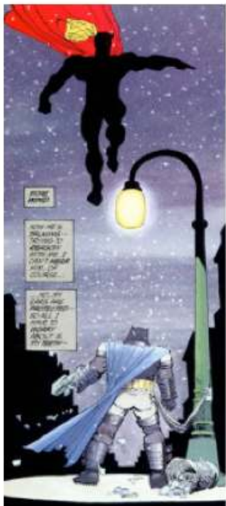
Une vignette de la bande dessinée de Frank Miller publiée en 1986, Batman: The Dark Knight Returns