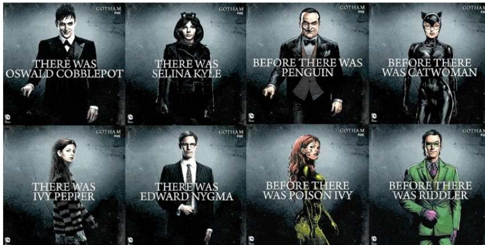
Illustration 2. Affiches promotionnelles de la deuxième saison de Gotham: Rise of the Villains

[En ligne]. http://www.fox.com/gotham/ . Page consultée le 30 janvier 2017.