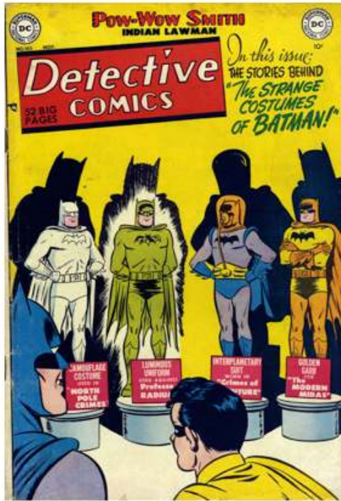
Illustration 3. Première de couverture

Win Mortimer ( Detective Comics , 165 : novembre 1950). Longtemps avant la fabrication des figurines de Batman, Finger incorporait déjà des costumes particuliers dans ses scénarios, comme on peut le constater dans la semi-rétrospective The Strange Costumes of Batman .