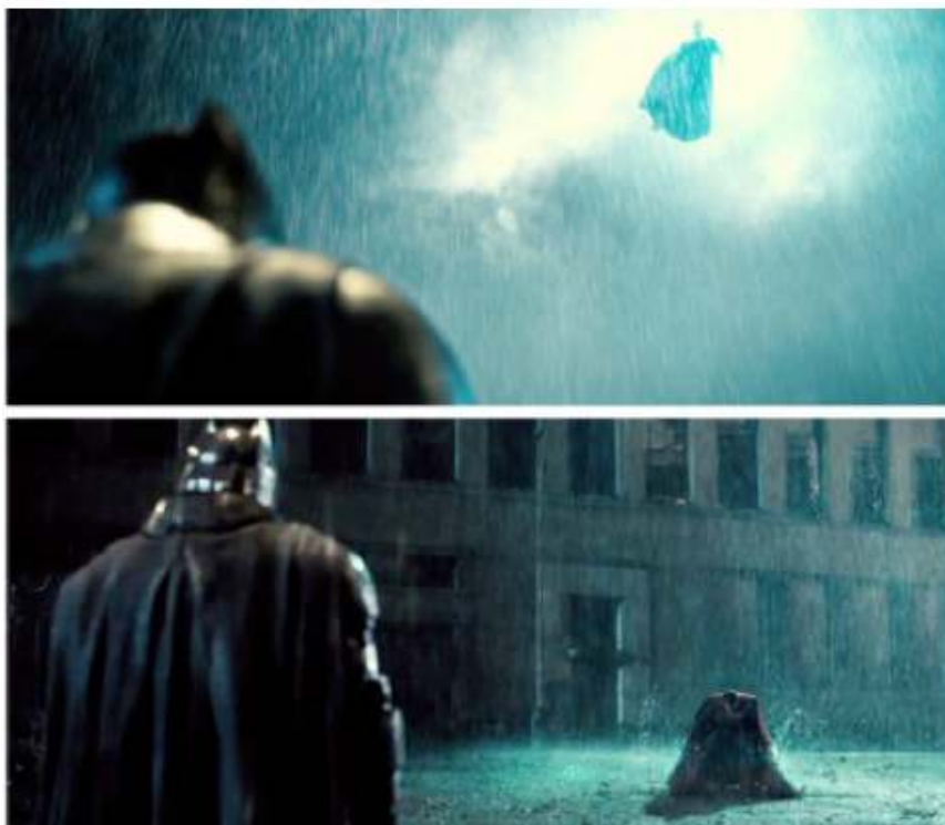
Une scène du film réalisé par Zack Snyder en 2016, Batman v Superman: Dawn of Justice