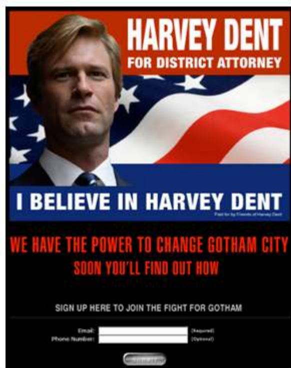
Illustration 5. Site Web du candidat de fiction Harvey Dent

On peut consulter l'historique du déploiement de la campagne virale à l'adresse suivante. [En ligne]. http://batman.wikibruce.com/lbelieveinharveydent.com . Page consultée le 30 janvier 2017.