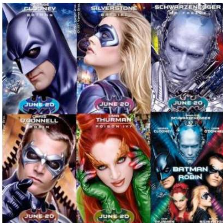
Illustration 4. Affiches promotionnelles mettant en vedette les personnages du film Batman & Robin