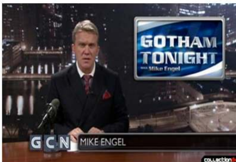
Illustration 7. Gotham Tonight with Mike Engel , vidéo virale

Les vidéos sont disponibles sur YouTube. [En ligne]. https://www.youtube.com/watch?v=DTQUJacmSLg . Page consultée le 30 janvier 2017.