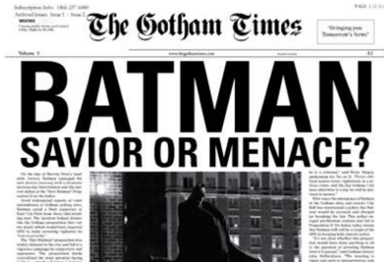
Illustration 6. La une du Gotham Times

[En ligne]. http://www.whysoseriousredux.com/thegothamtimes/home.htm . Page consultée le 30 janvier 2017.