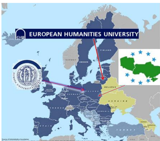
Carte 1 : localisation des universités

contribuer à favoriser la mobilité dans le monde académique et par là, à un rapprochement des pays de part et d'autre de la frontière extérieure de l'UE.