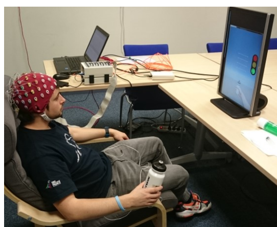
Figure 1 : Présentation générale du système Grasp'it : Le sujet génère des IMKs enregistrées via un casque EEG, le signal est analysé et traité, l'interface visuelle permet à l'utilisateur d'évaluer sa performance et l'invite à s'améliorer.

Imagination motrice kinesthésique ; EEG ; Interface cerveau-ordinateur; Retour visuel; AVC.