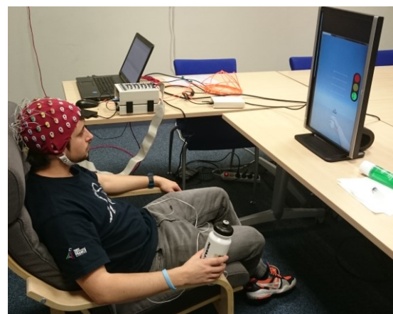
Figure 1 : Présentation générale du système Grasp'it : Le sujet génère des IMKs enregistrées via un casque EEG, le signal est analysé et traité, l'interface visuelle permet à l'utilisateur d'évaluer sa performance et l'invite à s'améliorer.

Imagination motrice kinesthésique ; EEG ; Interface cerveau-ordinateur; Retour visuel; AVC.