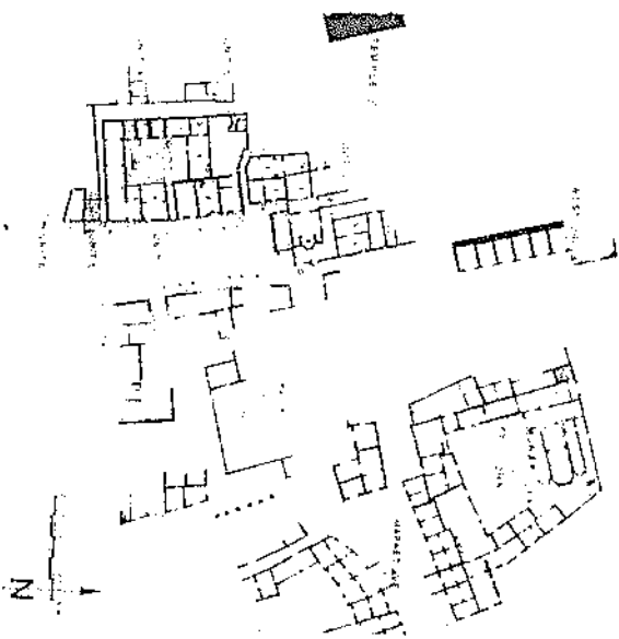
Fig. 1. — Plan au quartier sud, sud-est de Corinthe durant la période franque (dernier quart du xiii e siècle).

Avec ce plan, c'est un quartier entier de Corinthe à l'époque de la domination latine qui est dévoilé (108) . Les activités, nombreuses et variées, se répartissent selon les unités fouillées.