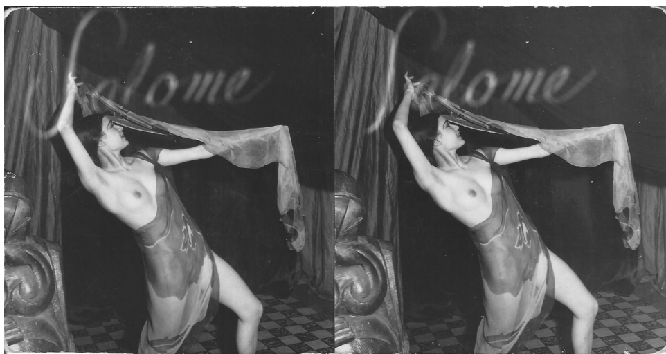
Salomé, Danse des sept voiles , Photographie stéréoscopique. Sn., sd., sl.

pas symptomatique d'une justification à apporter pour s'excuser d'un tabou consistant dans le simple plaisir de voir ?