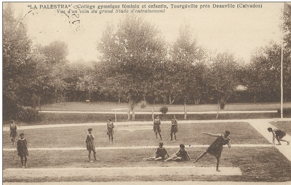
Image 2 – Carte postale représentant un coin du stade de La Palestra. À remarquer la tenue des athlètes qui peut évoquer l'imaginaire autour des danseuses d'Isadora Duncan.

ne, transmet l'hébertisme chez Charles Dullin, à l'Atelier, entre 1922 et 1924. Méthode Naturelle et hébertisme ne sont pas synonymes. L'hébertisme est un modèle holistique de transmission des techniques du corps élaboré par les monitrices hébertistes formées par Hébert au Collège d'Athlètes de Reims et qui s'institutionnalisent en communauté d'athlètes, à La Palestra – Collège gymnique féminin et enfantin – de Deauville-sur-Mer, en 1919.