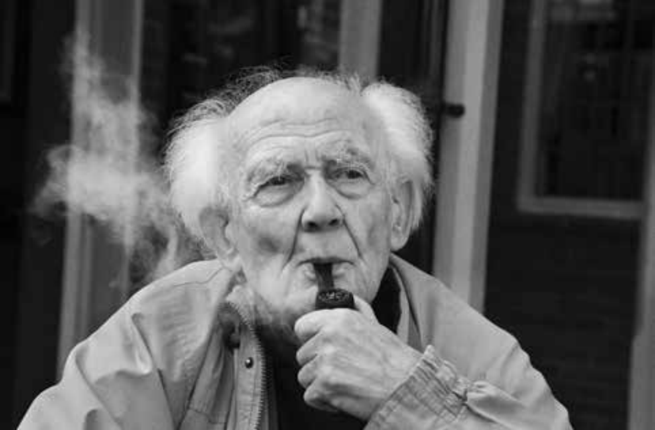
ZYGMUNT BAUMAN

Je crois que j'ai eu une très grande chance d'étudier et d'enseigner à l'université de Varsovie. À cette époque – c'est à peine croyable aujourd'hui –, c'était en vérité la seule université, à l'Est comme à l'Ouest, dans laquelle vous pouviez étudier tous les courants, points de vue, attitudes et théories existants en sociologie. Des marxistes aux « proclamés » antimarxistes, toutes les écoles de sociologie étaient présentes. Une telle variété était unique, on ne la retrouvait nulle part ailleurs à cette époque. D'une manière générale, les universités étaient divisées en partis et chapelles, qui étaient limités, limitants et contraignants.