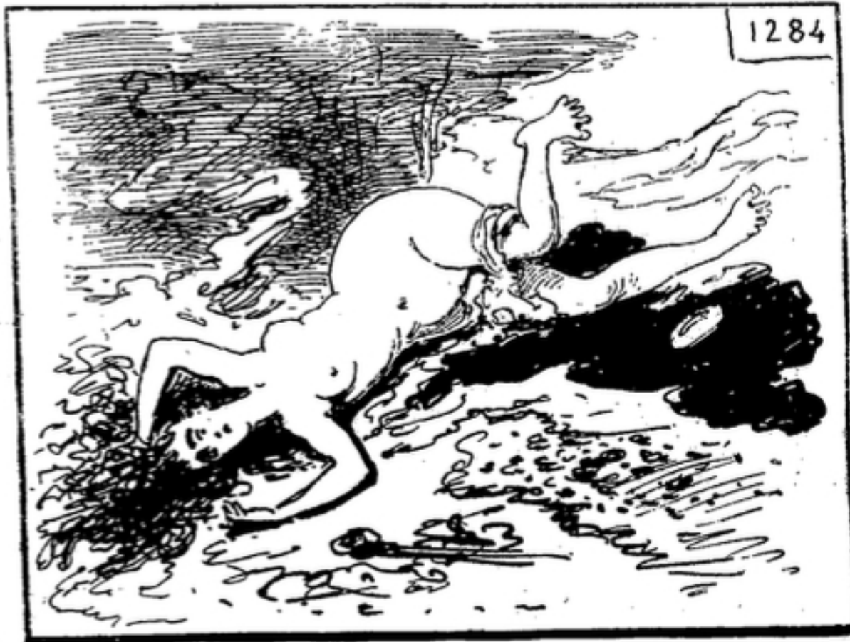
ROLL. — Colique.