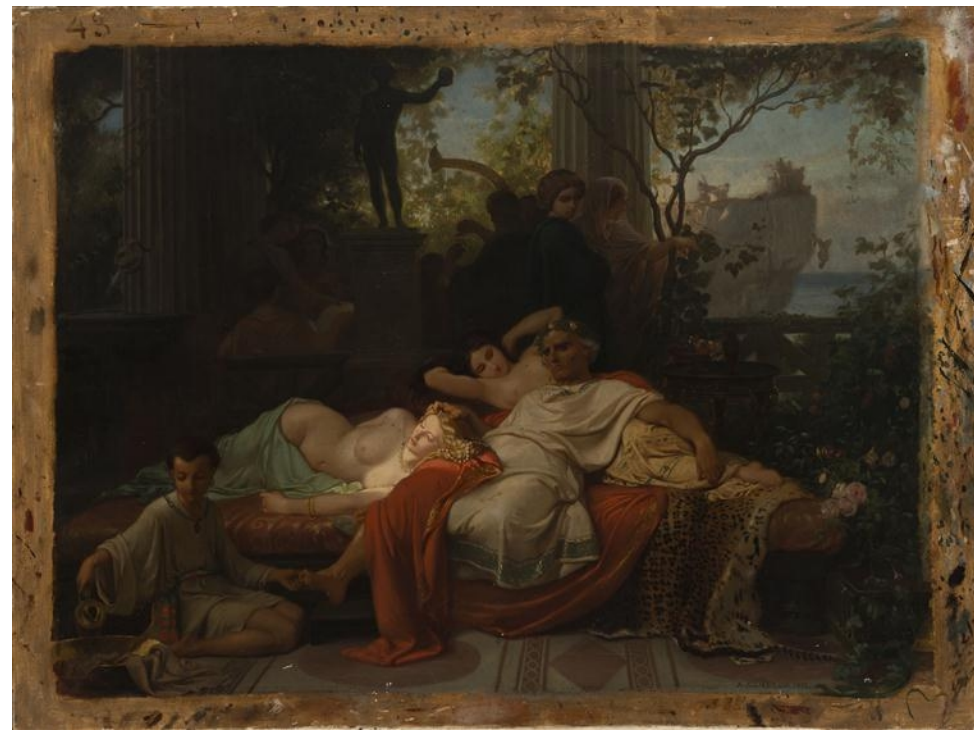
D'après Ernest Auguste Gendron, Tibère à l'île de Caprée , 1852, huile sur toile, 97,5 x 130 cm, Marseille, musée des Beaux-Arts, n° 529.