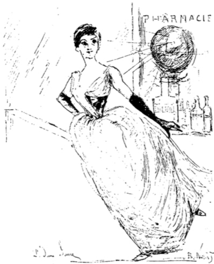
La Dame en jaune.

B. Nart, La Dame en jaune , catalogue illustré de l'exposition des Arts Incohérents de 1886, p. 89.