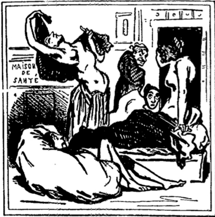
Jeunes femmes grecques suivant probablement un traitement pour la déviation de la taille.

Cham, « Revue comique du salon de 1851 », Paris, au bureau du Charivari . « Jeune femmes grecques suivant probablement un traitement pour la déviation de la taille. »