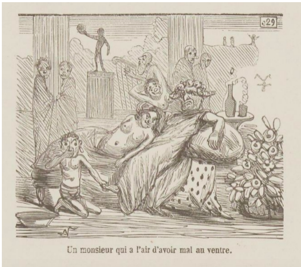
Nadar, Album du Salon, Nadar jury 1852 , Paris, aux bureaux de l'Éclair. « Un monsieur qui a l'air d'avoir mal au ventre. »