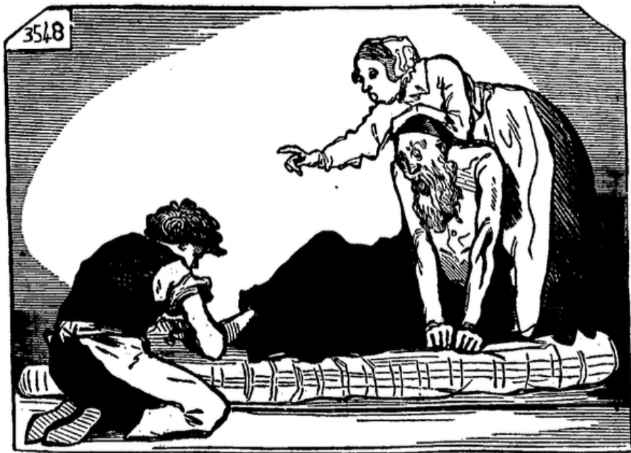
Le pédicure, par Lehmann.

Un vieux monsieur se livre à beaucoup de jérémiades et à son pédicure parce qu'il souffre vivement de ses cors. Sa femme inquiète recommande au pédicure de ne pas le couper.