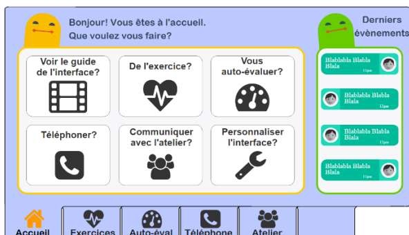
Figure 4. Nouvelle maquette

Maintenant que les résultats de la séance ont été analysés, ils pourront être présentés au prochain entretien collectif, et serviront de nouvelle base de discussion. De plus, toujours afin de générer des idées et du débat, une nouvelle maquette a été réalisée grâce aux retours précédents. A titre d'exemple, le panneau d'accueil est présenté sur la figure 4. Le but est ici d'améliorer la lisibilité, ainsi que l'ergonomie générale de l'IHM. Dans un premier temps, toutes les commandes ont été regroupées au centre de l'écran. De plus, elles ne sont plus uniquement nommées par un mot, tel que "groupe" ou "visio", mais directement par leur fonctionnalité.