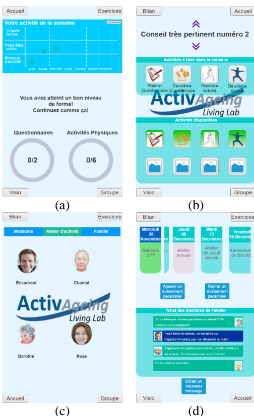
Figure 3. Maquette basique avec un panneau de bilan (a), d'exercices (b), de "visio" (c), et d'atelier d'activité (d)

Deux types de retours ont pu être faits suite au test utilisateur (8 femmes et 4 hommes, âgés de 62 à 80 ans) utilisant cette base, et grâce aux discussions qui s'en sont suivies. Le premier type de retours correspond à l'utilisation de l'interface elle-même, le second aux scénarios mis en place.