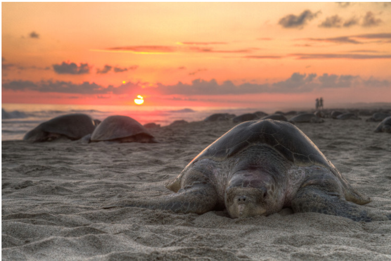
En période de ponte, les tortues marines recherchent les plages à l'obscurité préservée.

Du point de vue environnemental, les écologues montrent des espèces fortement perturbées par la lumière artificielle. On note des mécanismes d'attraction et de répulsion par les sources lumineuses et des perturbations, à échelles plus larges, d'espèces désorientées lors de leurs migrations. Plusieurs perturbations comportementales sont également relevées (communication, reproduction, prédation). Enfin, certains effets négatifs sont montrés sur la flore.