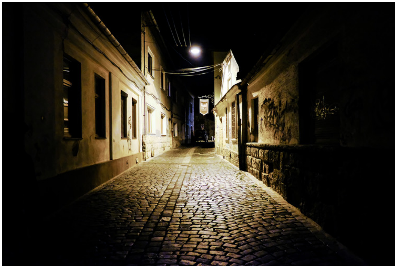
L'éclairage urbain d'une ruelle de la ville de Cluj-Napoca, en Roumanie. Samuel Challéat (2016)

C'est l'attention portée à ce que les usagers – humain et non-humains – font de et dans l'obscurité qui peut mener à l'adaptation locale de la norme d'éclairage.