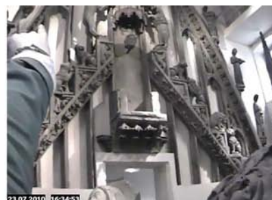
Les connaissances réellement construites par les visiteurs. Genny : "des êtres en suspension comme au cinoche dans les films de danse...". Gwenn : "j'aime vraiment bien la présentation des femmes, des Vierges". Fanny : "je trouve que c'est une salle impressionnante..." (captures d'écran extraites des perspectives subjectives en rapport avec les verbalisations des visiteurs).