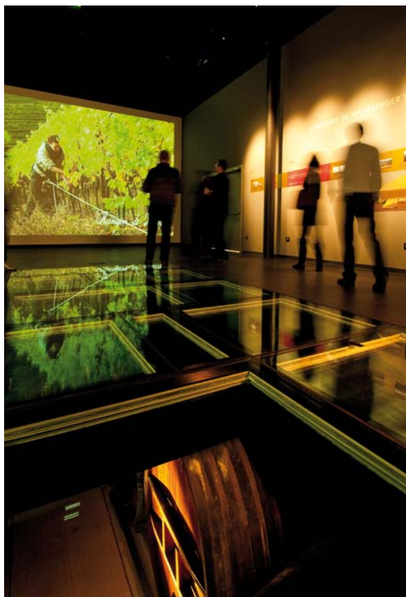
L'espace de découverte Wolfberger, à Eguisheim (Alsace)

Le programme de recherche "cours d'expérience" fondé sur des entretiens en re-situ subjectif vise à saisir et à comprendre comment les visiteurs des musées construisent du sens et des connaissances durant leur parcours de visite. Cette méthode permet de recenser les attentes et les savoirs mobilisés par les visiteurs, d'identifier les différentes façons de se relier au monde que constitue l'exposition et plus généralement d'envisager une nouvelle démarche de conception de la muséographie et de la médiation.