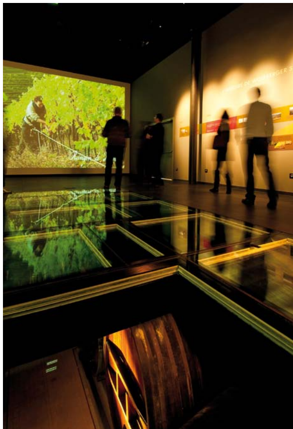
L'espace de découverte Wolfberger, à Eguisheim (Alsace)

Le programme de recherche "cours d'expérience" fondé sur des entretiens en re-situ subjectif vise à saisir et à comprendre comment les visiteurs des musées construisent du sens et des connaissances durant leur parcours de visite. Cette méthode permet de recenser les attentes et les savoirs mobilisés par les visiteurs, d'identifier les différentes façons de se relier au monde que constitue l'exposition et plus généralement d'envisager une nouvelle démarche de conception de la muséographie et de la médiation.