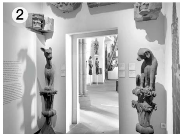
Influence de l'environnement sur les savoirs mobilisés : selon que la salle est peinte en noir (1) ou en blanc (2) les savoirs mobilisés ne sont pas les mêmes.