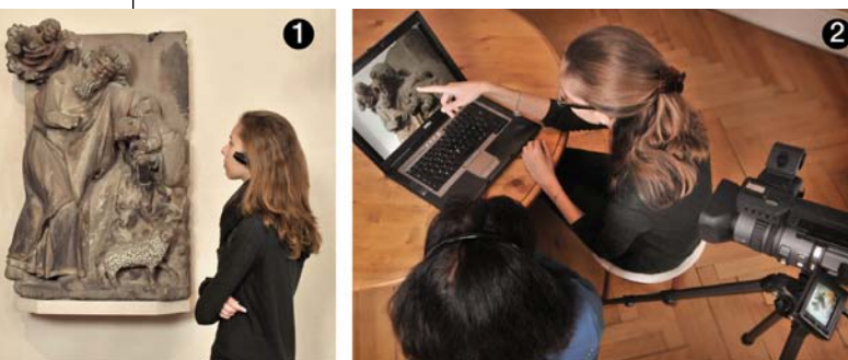
Les entretiens réalisés en re-situ subjectif. Les visiteurs sont équipés d'une mini-caméra et laissés à leur parcours de visite (1). Les visiteurs sont ensuite invités à décrire leur expérience à partir de ce film tandis qu'une caméra placée derrière le visiteur enregistre l'image de la vidéo, l'entretien et les gestes du visiteur (2).

Le visiteur revit alors en qualité son expérience, découpe spontanément son activité en séquences qui sont signifiantes de son point de vue. Nous pouvons nous arrêter sur des séquences particulières pour laisser au visiteur le temps de décrire son activité, ses émotions, ses attentes... Une caméra placée derrière le visiteur et le chercheur enregistre l'entretien, les gestes du visiteur avec les images sur l'écran vidéo. Bien entendu ces verbalisations ne sont pas l'expérience elle-même, mais elles rendent compte de l'expérience des visiteurs avec précision, finesse et profondeur (Schmitt, 2012) parce qu'elles peuvent être considérées à la fois comme des descriptions symboliques acceptables du domaine cognitif du visiteur (Varela, 1989) et comme effet de surface du couplage du visiteur et de son environnement (Theureau, 2006). À l'issue de cet entretien, l'enregistrement obtenu est transcrit, les séquences vidéo et les verbalisations associées sont analysées avec le logiciel Advene (Aubert et al., 2012) : nous identifions ce qui est pris en compte par le visiteur, la nature de sa relation à l'environnement, ses attentes, les savoirs mobilisés, les connaissances construites et son état émotionnel.