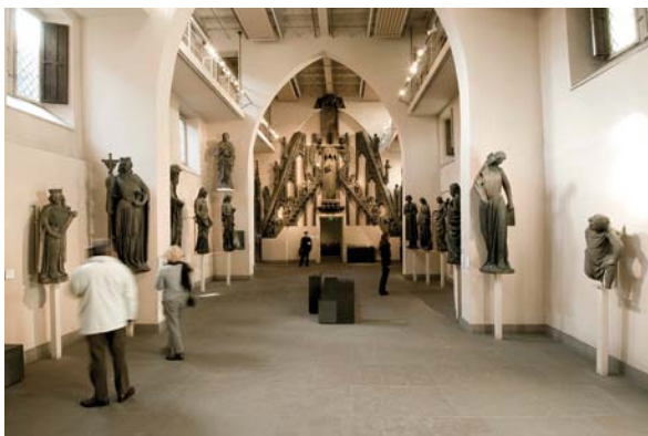
Connaissances attendues et connaissances construites. Du point de vue de l'institution, les visiteurs devraient pouvoir percevoir les œuvres comme des originaux et des œuvres majeures, retrouver leur emplacement d'origine sur la cathédrale et remarquer les différences stylistiques dans les trois sections séparées par des arches.

Ainsi, nous avons demandé aux responsables du musée de faire le parcours de visite tout en décrivant ce que les visiteurs devraient selon eux réussir à comprendre. Il ressort de ces entretiens un certain nombre d'attentes de l'institution. Avant tout, les visiteurs doivent comprendre que les œuvres sont des originaux et des œuvres majeures. Ils doivent ensuite pouvoir repérer leur emplacement d'origine sur la cathédrale, comprendre les étapes de la construction de la cathédrale et les différentes écoles stylistiques. Puis nous avons comparé les connaissances typicalisées des visiteurs avec les connaissances-types anticipées par l'institution. Si la plupart des visiteurs enquêtés appréhendent les sculptures de la salle du Jubé comme des œuvres majeures, peu de visiteurs saisissent les différentes étapes de construction de la cathédrale, la place originelle des sculptures et les influences stylistiques des écoles de sculpture. Nous avons ainsi mis en évidence les écarts qui peuvent exister entre la perception par l'institution de la muséographie en place et celle qu'en ont les visiteurs.