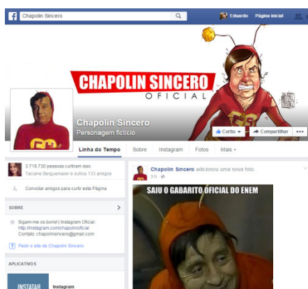
Figura 8 - Página do meme Chapolin Sincero.

A primeira página escolhida foi a página do meme Chapolin Sincero 27 (Figura 8). Segundo dados disponibilizados no Facebook do meme, a página foi criada em agosto de 2012 e o criador da mesma foi um estudante de Publicidade. A página conta com mais de 3,7 milhões de curtidas. O meme mais recente da página, postado no dia 29 de outubro de 2015, obteve mais de 7.954 curtidas e 1.204 compartilhamentos.