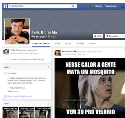
Figura 9 - Página do meme Félix Bicha Má.

A segunda página escolhida foi a do meme Félix Bicha Má 28 (Figura 9). Segundo dados disponibilizados na página do Facebook do meme, a página foi criada em 2013, e conta com mais de 3,3 milhões de curtidas. O meme mais recente da página, postado no dia 22 de outubro, obteve mais de 8 mil curtidas e quase 7 mil compartilhamentos.