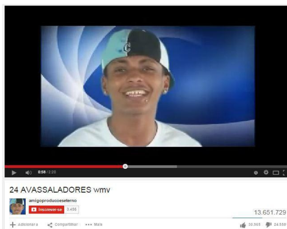
Figura 7 - Clipe original da música "Sou foda" do grupo musical Avassaladores.

DOI: http://dx.doi.org/10.20873/uft.2447-4266.2016v2n1p277