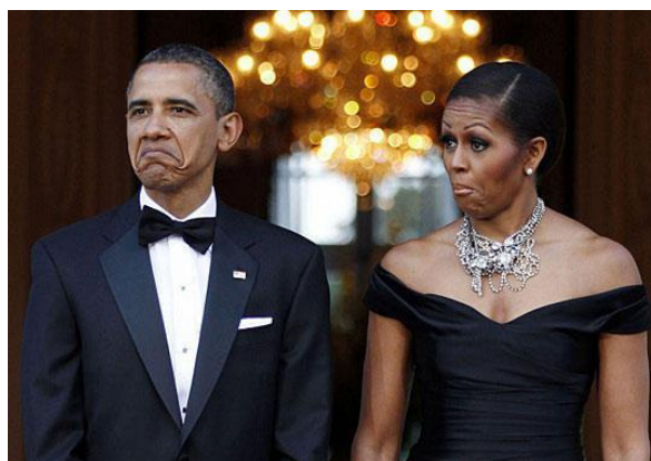
Figura 6 - Foto original que serviu como inspiração para a criação do meme Not Bad .

No Brasil, os memes acabaram recebendo um outro nome: mene. A própria