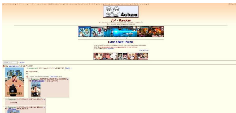
Figura 1 - Interface do subfórum "Random", mais conhecido como /b/.

liberdade sobre o conteúdo postado (CHEN, 2012).