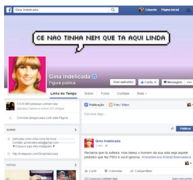
Figura 10 - Página do meme Gina Indelicada.

DOI: http://dx.doi.org/10.20873/uft.2447-4266.2016v2n1p277