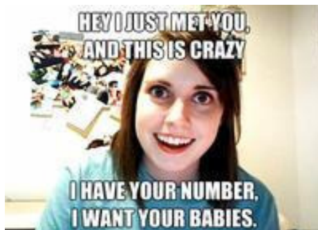
Figura 3 - Exemplo do meme Overly Attached Girlfriend .

Além dos memes como imagens e textos, há outro tipo de meme: as Rage Faces , ilustrações grotescas de expressões humanas como raiva, decepção, desejo, etc. São inseridas em formato de quadrinhos denominados Rage Comics representando situações cotidianas. O Rage Guy , postado no 4chan em 2008, foi o primeiro personagem a ser criado (Figura 4), dando origem às Rage Comics e geralmente é utilizado para demonstrar frustração extrema e muita raiva (LUIZ, 2012).