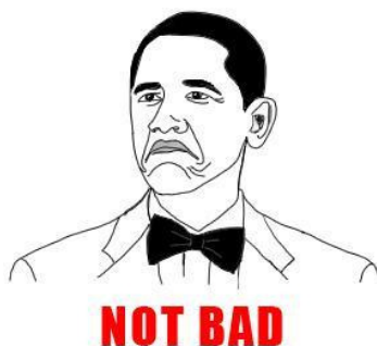
Figura 5 - O meme Not Bad baseado na foto de Barack Obama.

As Rage Faces também foram criadas com base em fotografias de pessoas famosos, como é o caso do meme Not Bad 17 (Figura 5) baseado em uma fotografia do presidente norte-americano Barack Obama durante uma visita ao Reino Unido em 2011 (Figura 6). O meme é usado como uma resposta positiva a alguma surpresa recebida, algo que surpreendeu as expectativas.