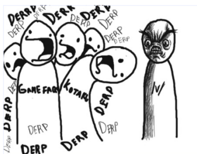
Figura 4 - Primeira imagem do rageguy postada no 4chan. Fonte: google.com .

Além dos memes como imagens e textos, há outro tipo de meme: as Rage Faces , ilustrações grotescas de expressões humanas como raiva, decepção, desejo, etc. São inseridas em formato de quadrinhos denominados Rage Comics representando situações cotidianas. O Rage Guy , postado no 4chan em 2008, foi o primeiro personagem a ser criado (Figura 4), dando origem às Rage Comics e geralmente é utilizado para demonstrar frustração extrema e muita raiva (LUIZ, 2012).