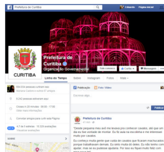
Figura 11 - Página do meme Prefeitura de Curitiba.

E por último a página oficial Prefeitura de Curitiba 30 (figura 11), órgão público do município de Curitiba, possui, segundo dados disponibilizados no Facebook, possui quase 700 mil curtidas e seu último meme, postado no dia 29 de outubro de 2015, possui mais de 400 curtidas e 32 compartilhamentos.