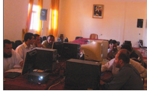
صورة 1 - 2 : ورشة تكوين في نظم المعلومات الجغرافية (الدورة الأولى، يونيو 2009) تاحنات