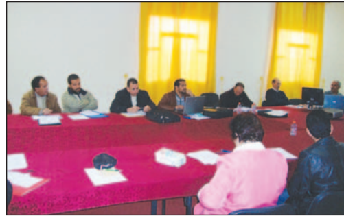
صورة 3 - 4: ورشة تكوين في التنمية القروية بتاحنات 1 - 5 مارس 2010.

وفي إطار استراتيجية مجموعة البحث، اعتبر تأسيس وحدة تربوية للتكوين والبحث تابعة لمدرسة الدكتوراه بالكلية، حول موضوع «التنمية المحلية وتهيئة المجال الريفي ببلدان المغرب العربي»، ثمرة جهود الأساتذة المؤسسين لها، والمشرفين على أبحاث طلبتها والمؤطرين لهم (3) . وجدير بالتذكير، بأن