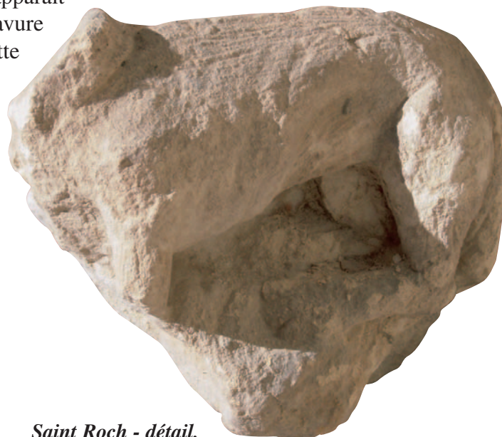
Saint Roch - détail.