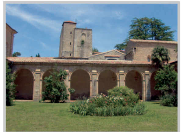
Cloître de 1760

Le cloître est édifié en 1760, comme l'indiquent les inscriptions sur un pilier et une tomette de la travée