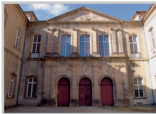
Composition très classique du corps principal.