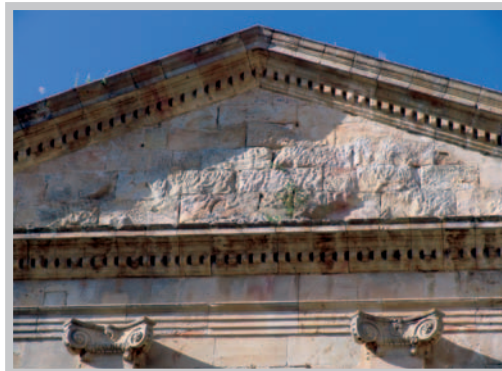
Fronton buché à la Révolution.

- une agrafe (A 4) également sur la façade est, accolée aux deux précédentes, reprend les mêmes éléments mais avec un décor de fleurette et d'acanthé ;