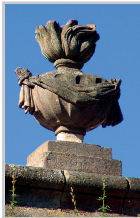
Pot-à-feu du portail d'entrée.

La cour d'honneur de l'abbaye est un ensemble monumental qui ne diffère pas des architectures civiles contemporaines et aucun élément décoratif ne permet de lui attribuer un quelconque sens religieux. Elle est composée d'une avant-cour de service et d'une arrière-cour qui constitue la cour d'honneur proprement dite. Outre les pots-à-feu qui surmontent la grille d'accès et qui semblent avoir été réalisés peu de temps avant la Révolution, l'essentiel de la décoration architecturale est sculpté sur la partie noble de l'ensemble, l'arrière-cour. Cette dernière semble avoir été réalisée de 1745 à 1779, sous l'abbatiat d'Armand Bazin de Bezons.