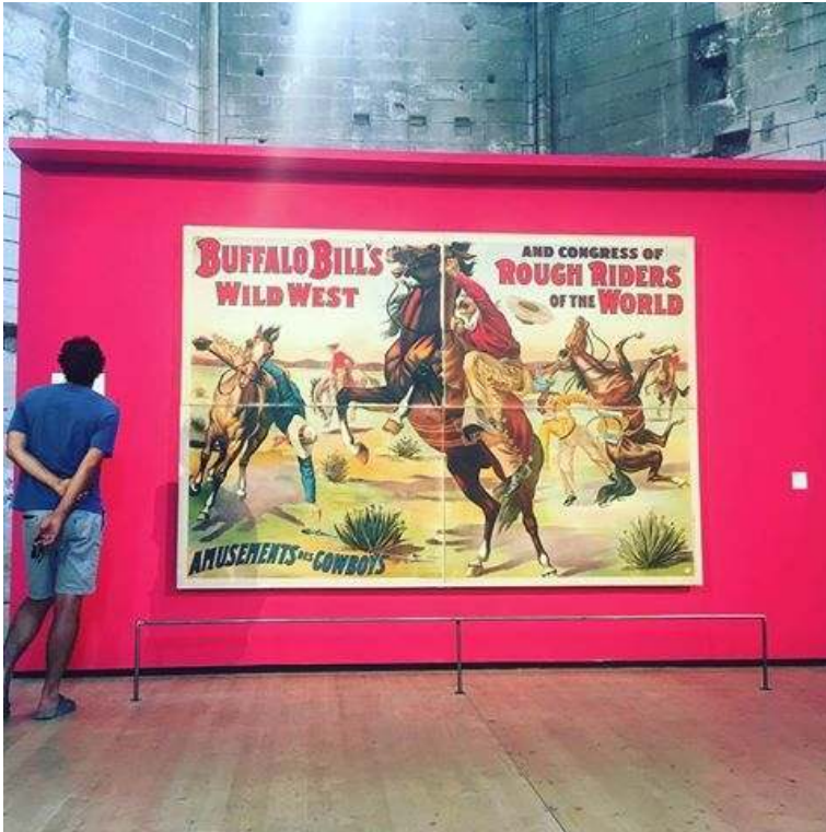
Vue de l'exposition "Western Camarguais" aux Rencontres d'Arles 2016