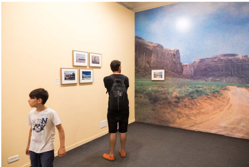
Vue de l'exposition "Western Stories" aux Rencontres d'Arles 2016