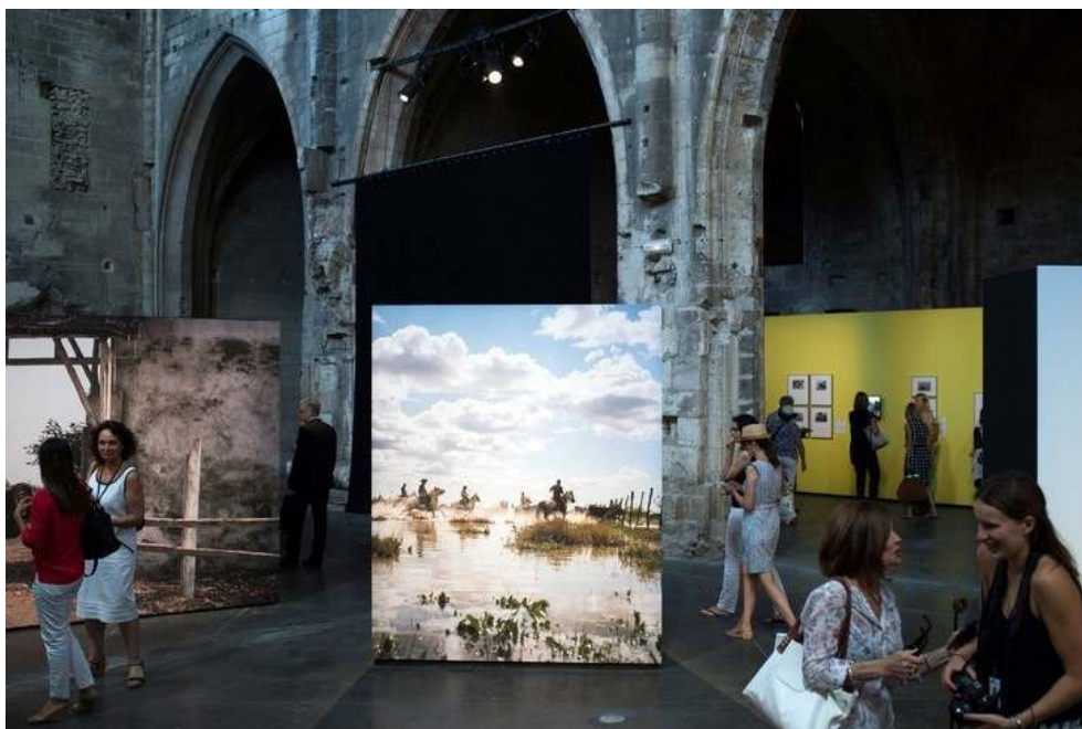
Vue de l'exposition "Western Camarguais" aux Rencontres d'Arles 2016