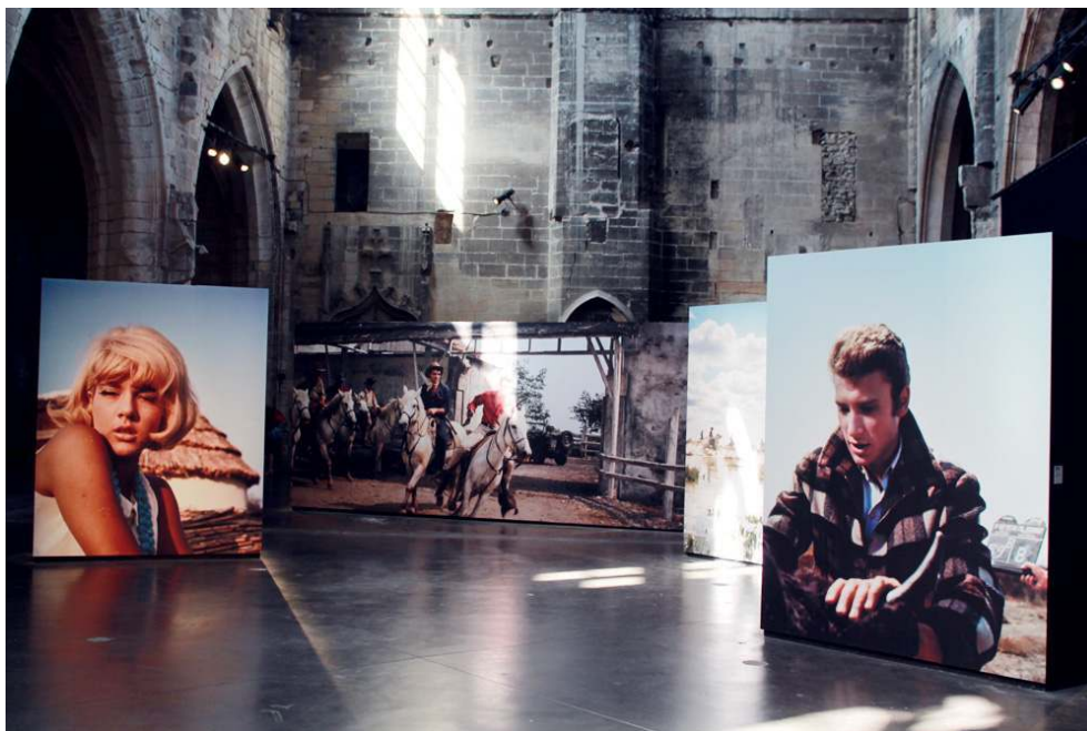
Vue de l'exposition "Western Camarguais" aux Rencontres d'Arles 2016