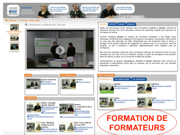
Figure 1 : EIAH EDFPass

Dans l'EIAH conçu pour l'entreprise EDF (Fig. 1), l'enjeu identifié comme crucial et donc pris pour objet de formation est l'évaluation en formation . L'enjeu est partagé entre trois types de professionnels et de préoccupations : (i) les formateurs (bienveillance, exigence et responsabilité vis-à-vis de l'habilitation) ; (ii) les opérateurs / stagiaires (développement professionnel, image sociale et responsabilité vis-à-vis de leur service) et (iii) les managers (productivité, montée en compétence et responsabilité vis-à-vis de la sûreté).