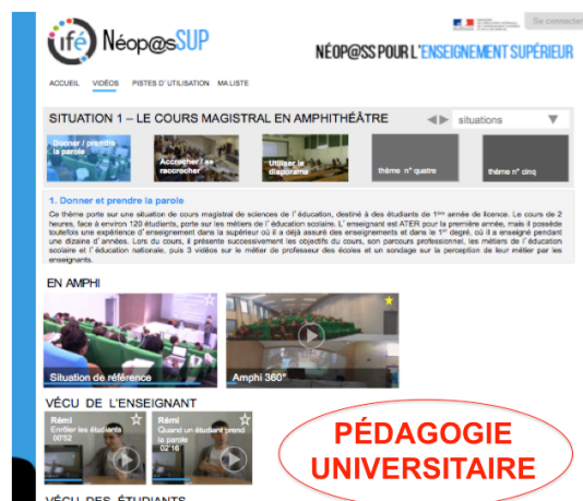
Figure 3 : EIAH NéoPass'Sup

Dans le projet « NéoP@ss'SUP », l'EIAH conçu (Fig. 3) se veut une aide à la formation des enseignants du supérieur, notamment débutants. L'analyse de leur activité et de celle de leurs étudiants dans une configuration typique du métier (le cours magistral en amphithéâtre) a permis de cibler des situations ayant un fort potentiel de développement (« donner et prendre la parole », « utiliser un support projeté »...) Elles sont scénarisées dans le but d'aider les formés à y être plus efficaces.