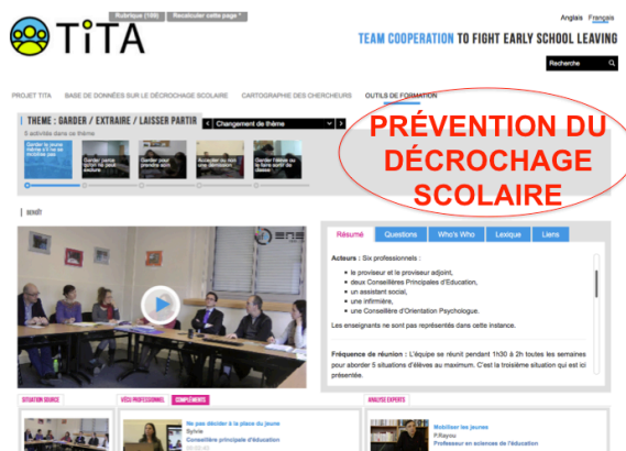
Figure 2 : EIAH TITA

Dans le projet « Training, Innovative Tools and Actions » (Fig. 2) pour l'aide à la prévention du décrochage scolaire, les objets de formation sont des dilemmes vécus par les acteurs (milieux scolaire, social, médical) en charge d'élèves qualifiés de « décrocheurs » ou « en voie de décrochage ». Ils portent notamment sur l'internalisation vs l'externalisation de la prise en charge à différents niveaux (classe, établissement, système scolaire), options pouvant être instruites par les formés.