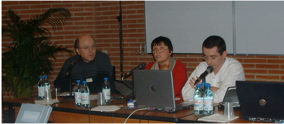
Figure 3. La conférence finale du projet européen, communication IREM-UOC