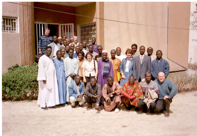
Figure 2. Séminaire de l'IREMPT à Dakar, avec la participation de trois animateurs de l'IREM de Montpellier

L'IREM est enfin un élément d'un réseau, national et international. Être directeur d'IREM suppose donc de participer à l'animation de ce réseau national et prédispose à rechercher des collaborations avec des instituts du même type à l'étranger. Depuis 7 ans, l'IREM de Montpellier a ainsi noué des liens forts avec l'IREMPT (Institut de Recherche sur l'Enseignement des Mathématiques, de la Physique et de la Technologie) et l'ENS (Ecole Nationale Supérieure) de Dakar. Cette collaboration se traduit par des échanges réguliers entre les équipes des différents instituts (Figure 2), et par des missions dans les deux sens chaque année, sources d'enrichissement très important pour les équipes impliquées.