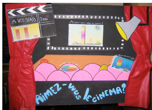
Figure 1. Premier prix « A vos stats 2004 » (collège G. Brassens, Narbonne)

L'activité de l'IREM peut être décomposée en trois grands volets : un volet principal de recherches et de production de ressources pédagogiques, un volet de formation continue et un volet d'actions plus ponctuelles. Le volet formation continue comporte à la fois un cycle de conférences et des stages en liaison avec les recherches menées à l'IREM. Les actions ponctuelles sont très diverses (action en direction des lycéens ou participation à des projets de recherche de courte durée), visant à promouvoir la culture scientifique et la réflexion sur l'enseignement des mathématiques.