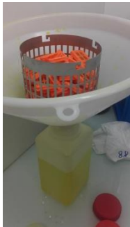
Figure 3. Dispositif permettant de récolter le liquide de Bouin (photo ?)

contenant le liquide de Bouin usagé sera ensuite traité comme déchet chimique ( Figure 3 ). C'était déjà le cas avant de mettre cette technique au point.