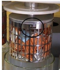
Figure 3. Installation du panier sur l'automate (petites encoches à enclencher pour bien maintenir le panier autour du cercle noir) (photo :).

Pratiquement, je récupère le panier inox posé sur l'entonnoir et j'installe son couvercle. Je fixe ce panier directement sur l'automate en position 1 prévue à cet effet ( Figure 4 ). Je mets de l'eau courante dans les bacs numérotés de 1 à 6 bis à la place de l'éthanol qu'ils contiennent habituellement. Le bac 6 bis est un bac supplémentaire dont je ne me sers que pour le rinçage. J'ai créé un programme spécial, pour que le programme s'arrête dans le bac « 6 bis ».