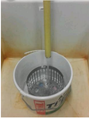
Figure 1. Dispositif de rinçage utilisé avant la mise au point de la méthode décrite dans cet article

Je fais en moyenne 20 cycles de déshydratation d'échantillons fixés au liquide de Bouin par an, soit environ 10 000 L d'eau qui partaient au tout à l'égout. La technique que j'ai mise au point et que je présente ci-dessous ne produit plus que 200 L d'eau souillée traités par la filière déchets chimiques.