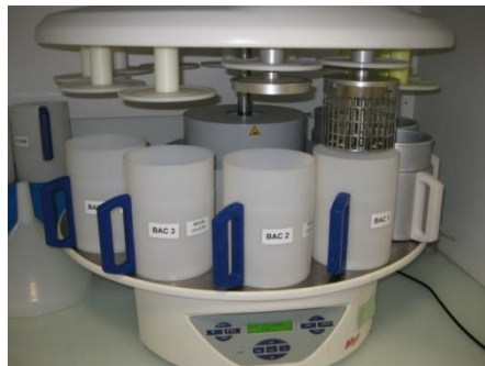
Figure 2. Automate de déshydratation modèle STP120 de marque MYR (photo :

Pour diminuer la consommation d'eau et pour éviter de polluer les eaux usées, j'ai mis en place une nouvelle technique de rinçage en utilisant l'automate de déshydratation présenté dans la Figure 2 .