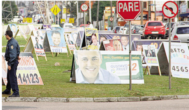
Figura 2: Cavaletes de propaganda política – primeira imagem

Na primeira imagem analisada, encontramos uma placa de sinalização indicando “Pare”, uma segunda placa informando que não é possível dobrar à esquerda; aparentemente um guarda (não fica claro se é um guarda de trânsito ou não); duas outras placas mais ao fundo; um grande fluxo de movimentos de carros ao lado direito da figura; e uma quantidade enorme de cavaletes de propaganda eleitoral, com destaque para o candidato Fruet mais à frente e outra publicidade ao lado em que não se pode identificar o candidato, mas visualiza-se o número deste candidato.