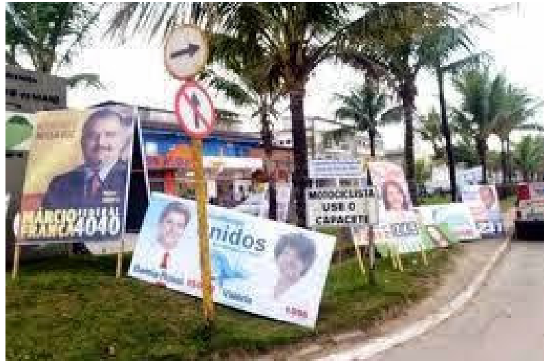
Figura 4: Cavaletes de propaganda política – terceira imagem