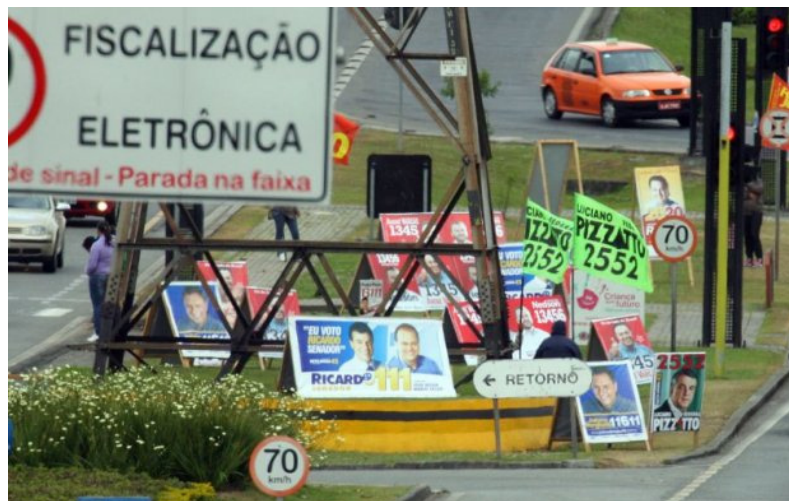
Figura 3: Cavaletes de propaganda política – segunda imagem

Fica evidente, pelos princípios da Gestalt, que a enorme quantidade de elementos e a disposição destes elementos, não permite o agrupamento das informações, pois no caso os objetos estão muito próximos uns dos outros, não há unidade entre os cavaletes e a paisagem urbana, nem similaridade e nem continuidade, afetando, com isso, a compreensão, a percepção e a fluidez visual.