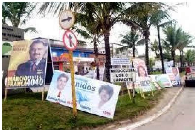
Figura 4: Cavaletes de propaganda política – terceira imagem