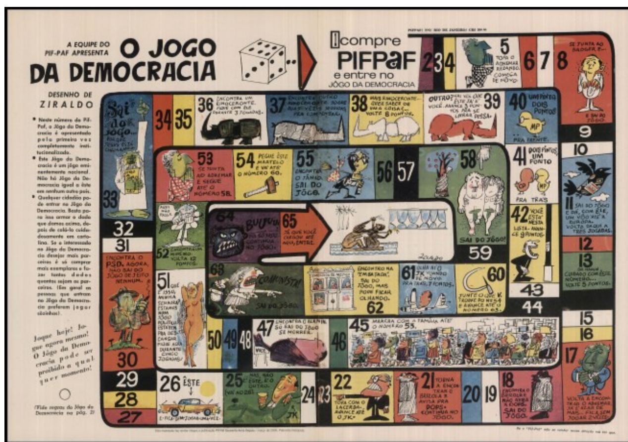
Revista Pif-Paf, n. 2, junho 1964, p. 1 e p. 24. Direitos de utilização e reprodução da imagem sem fins lucrativos concedidos à autora

O “Jogo da Democracia”, desenhado por Ziraldo no segundo número da revista Pif-Paf em junho de 1964, é um dos exemplos da subversão dos códigos, das normas, das referências culturais e políticas permitida pelo humor gráfico publicado nas páginas de jornais ou revistas independentes durante o regime militar, a partir do golpe militar de 1964. Alguns dos objetivos da análise das suas diversas formas, tais como a caricatura, a história em quadrinhos, a charge, a gravura ou o corte-colagem de