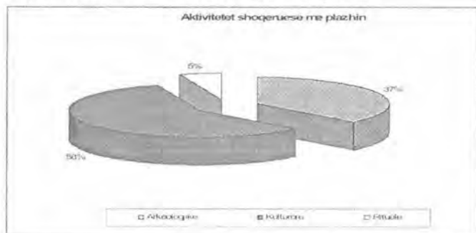
Grafiku 3. Potenciali i aktiviteteve shoqëruese me plazhin

Ndërkohe që grafikët 1 dhe 2 ofrojnë një pikturë shumë të përgjithshme të nivelit të zhvillimit të turizmit arkeologjik e historik në rrethin e Durrësit, Grafiku 3 tregon interesin e turistëve vendas për të kombinuar pushimet në plazh me aktivitete kulturore që dëshirohet nga 58 përqind turistëve ndërkohe që 37 përqind prej tyre dëshirojnë vizita në objektet arkeologjike.