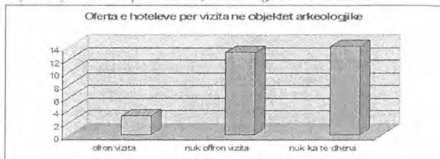
Grafiku 5: Ofirta e hoteleve për vizita në objektet arkeologjike dhe zonat historike

Rezultatet janë pothuajse të njëjta për ofertën e hoteleve për aktivitetet kulturore. Ndërkohë që hotelet ofrojnë pak shërbime të tjera përveç atyre të hotelerisë dhe restorant-barit kërkesa e turistëve për informacion për objektet arkeologjike e historike në qytetin dhe rrethin e Durrësit është e ndjeshme. Kështu nga të dhënat e anketimit rezultoi se 48 përqind e të intervistuarve nuk kanë informacion për zonat arkeologjike dhe historike ndërkohë që 44 përqind e tyre kanë kërkuar informacion, ndërsa vetëm 8 përqind e të intervistuarve nuk kanë interes për informacion.