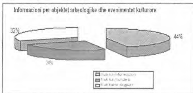
Grafiku 2: Informacioni për objektet arkeologjike dhe evenimentet kulturore

Ndërkohe që grafikët 1 dhe 2 ofrojnë një pikturë shumë të përgjithshme të nivelit të zhvillimit të turizmit arkeologjik e historik në rrethin e Durrësit, Grafiku 3 tregon interesin e turistëve vendas për të kombinuar pushimet në plazh me aktivitete kulturore që dëshirohet nga 58 përqind turistëve ndërkohe që 37 përqind prej tyre dëshirojnë vizita në objektet arkeologjike.