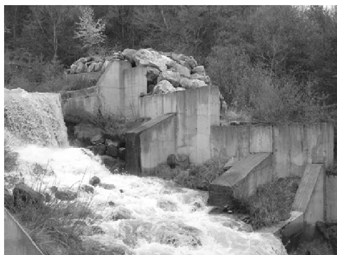
FIGURE 1. DIGUE COMPOSITE A PAREMENT EN BETON ARME EN PARTIE AMONT DU DISPOSITIF (TRONÇON 2-RG).

Les digues ont commencé à être édifiées après la crue dévastatrice de 1948, en vue d'empêcher le débordement du torrent sur son cône de déjection. En partie amont du dispositif de protection, l'endiguement a été renforcé côté torrent à la fin des années 1970 (création de murs-épîs en béton armé : Figure 1), puis complété en 1994-1995 en partie aval. Entre les cotes 1485 m et 1375 m, le système d'endiguement englobe aujourd'hui quelque 900 m de digues (digues en remblai ou à structure composite béton-remblai ou enrochement-remblai), réparties entre rives gauche et droite, le long d'environ 750 m de cours d'eau. En rive gauche, l'endiguement est quasi-continu alors qu'en rive droite il est interrompu par des tronçons de berge dépourvus de digue ou ne comportant que des « digues » de hauteur inférieure à 1 m (cordons de curage ou dépôts torrentiels naturels).