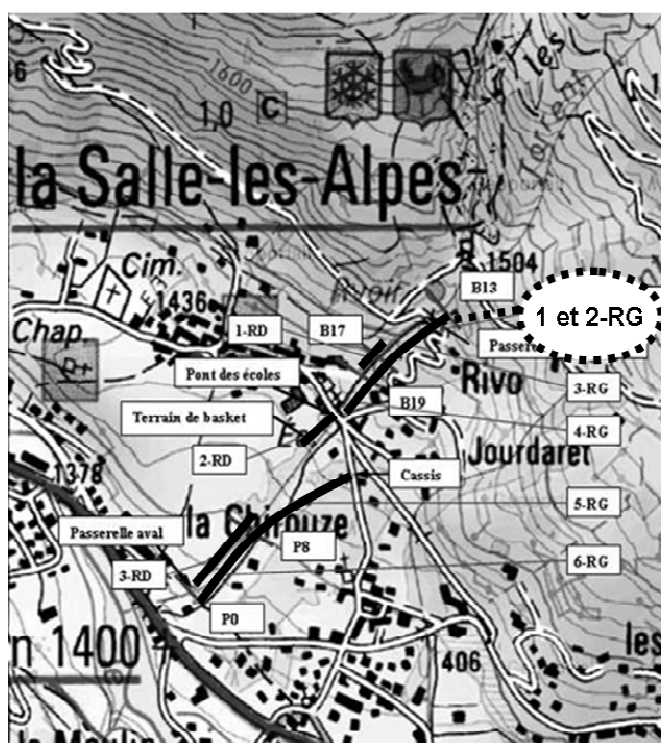
FIGURE 2. PLAN DE SITUATION DES DIGUES DU TORRENT DE LA SALLE. LOCALISATION DES TRONÇONS 1 ET 2-RG, A L'AMONT DU DISPOSITIF, ET DES ENJEUX EN RIVE GAUCHE SUR LE CONE DE DEJECTION (D'APRES IGN-GEOPORTAIL, NORD EN HAUT).

Les enjeux protégés par ces digues sont essentiellement situés en rive gauche, sur le cône de déjection : une centaine de maisons dont une majorité sont des résidences secondaires construites après 1960 (Figure 2). En rive droite, une vingtaine de constructions est protégée, parmi lesquelles seule une demi-douzaine de bâtiments appartient au village ancien de La Salle ou à son école. La présence de ces enjeux justifie le classement en C des digues.