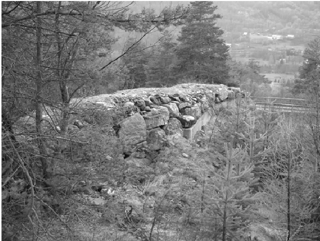
FIGURE 4. TRONÇON DE DIGUE REHAUSSEE 1-RG. PAREMENT COMPOSITE COTE TORRENT (BETON ET ENROCHEMENTS).

Le bief n°1 est délimité par deux barrages transversaux (B13 à l'amont et B14 à l'aval). Il est bordé en rive gauche par le tronçon de digue 1-RG (Figure 4), dont la structure composite est décrite plus haut, et ne présente pas d'endiguement en rive droite.