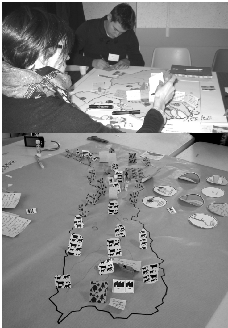
Figure 2 – Des participants à l'atelier du climat de la Tille ; Exemple de carte du territoire futur réalisée pour l'Armançon.

Pour la troisième étape, les designers ont eu recours à des photos, points de départ pour imaginer la même situation en 2043 et faire de ces photos des « cartes postales du futur ». La créativité des participants était alors sollicitée sur le mode analogique : quelles associations d'idées sont formulées, à l'évocation de ces situations éloignées dans le temps ? Le design a commencé à produire des éléments d'adaptation à partir de la quatrième étape, en deuxième séance. Sur l'Armançon, elle consistait à réaliser des cartes en relief par la matérialisation d'activités économiques, sociales et des infrastructures, symbolisées par des pictogrammes qu'il fallait découper et coller sur la carte (cf. Fig. 2). Cette approche kinesthésique du territoire était aussi une façon de libérer la créativité des participants. Selon les designers 6 , le dessin rend explicite le dessein. En se mettant en mouvement pour modeler une carte, les participants étaient placés dans un rôle actif pour construire le futur. La participation reposait sur un savoir et un faire combinés, rendant effective la participation (Borzeix et al. , 2015).