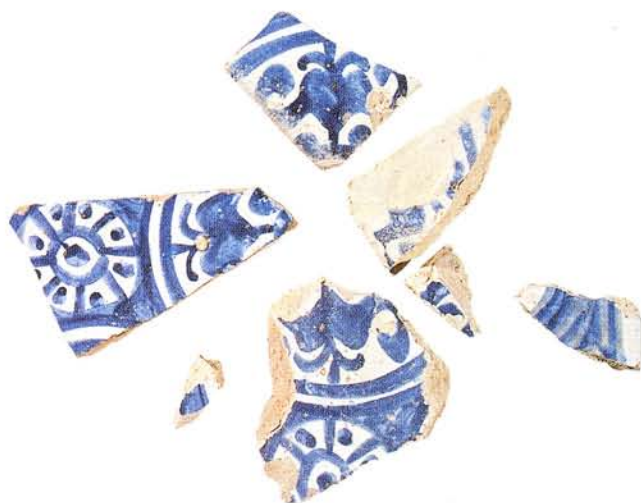
fig. 2. Carreaux découverts au sud de l'hôpital Sainte-Marthe à Avignon, remblais de la première moitié du XV e siècle. Coll. SRA, DRAC, service départemental d'Archéologie du Vaucluse (cl. C. Durand, CNRS, CCJ)