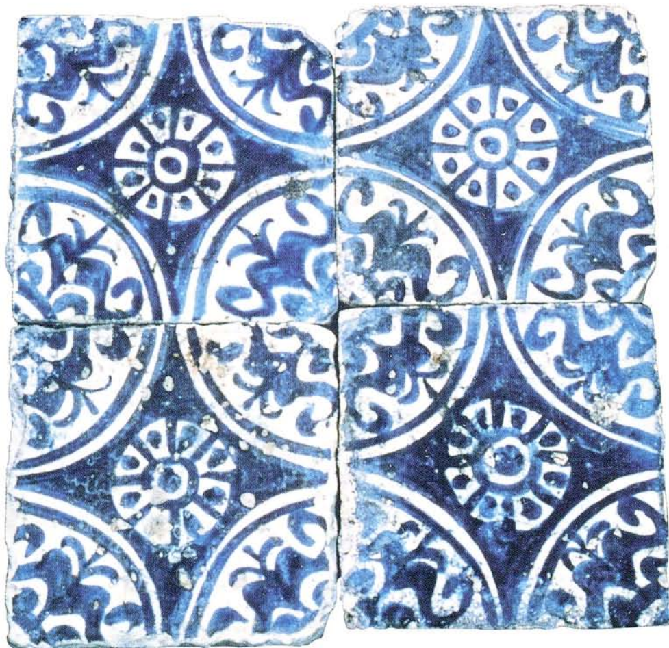
fig. 1. Carreaux de l'Hôtel de Brion à Avignon, XV e siècle. Coll. Avignon, musée du Petit-Palais