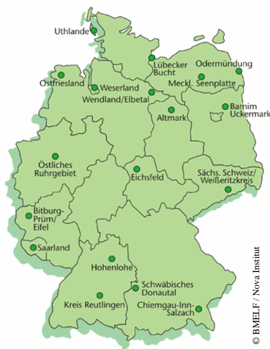
Cartes 2 et 3 : les 148 groupes d'action locaux (GAL) allemands de l'initiative communautaire LEADER+ (2000-2006) et les 18 « Modellregionen » du programme Regionen Aktiv 2002-2006.

Pourtant, l'articulation entre les deux logiques semble essentielle : si les logiques locales de projet et d'aménagement permettent la plus grande efficacité des politiques publiques, une appréhension globale des enjeux de la ruralité et sa planification d'ensemble est tout autant essentielle pour donner une force et une visibilité aux territoires ruraux face aux enjeux parfois sélectifs et inégalitaires des processus économiques contemporains.