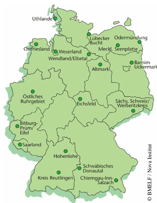
Cartes 2 et 3 : les 148 groupes d'action locaux (GAL) allemands de l'initiative communautaire LEADER+ (2000-2006) et les 18 « Modellregionen » du programme Regionen Aktiv 2002-2006.

Pourtant, l'articulation entre les deux logiques semble essentielle : si les logiques locales de projet et d'aménagement permettent la plus grande efficacité des politiques publiques, une appréhension globale des enjeux de la ruralité et sa planification d'ensemble est tout autant essentielle pour donner une force et une visibilité aux territoires ruraux face aux enjeux parfois sélectifs et inégalitaires des processus économiques contemporains.