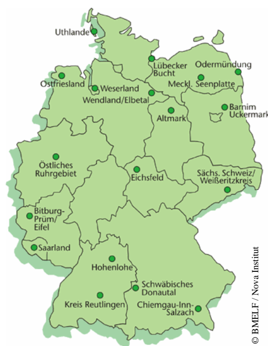
Cartes 2 et 3 : les 148 groupes d'action locaux (GAL) allemands de l'initiative communautaire LEADER+ (2000-2006) et les 18 « Modellregionen » du programme Regionen Aktiv 2002-2006.

Pourtant, l'articulation entre les deux logiques semble essentielle : si les logiques locales de projet et d'aménagement permettent la plus grande efficacité des politiques publiques, une appréhension globale des enjeux de la ruralité et sa planification d'ensemble est tout autant essentielle pour donner une force et une visibilité aux territoires ruraux face aux enjeux parfois sélectifs et inégalitaires des processus économiques contemporains.