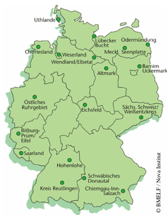
Cartes 2 et 3 : les 148 groupes d'action locaux (GAL) allemands de l'initiative communautaire LEADER+ (2000-2006) et les 18 « Modellregionen » du programme Regionen Aktiv 2002-2006.

Pourtant, l'articulation entre les deux logiques semble essentielle : si les logiques locales de projet et d'aménagement permettent la plus grande efficacité des politiques publiques, une appréhension globale des enjeux de la ruralité et sa planification d'ensemble est tout autant essentielle pour donner une force et une visibilité aux territoires ruraux face aux enjeux parfois sélectifs et inégalitaires des processus économiques contemporains.