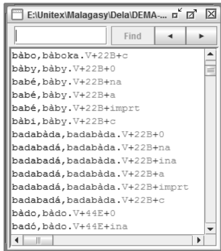
Figure E : DEMA-NVSflx

Les variantes morphologiques des radicaux verbaux formant des noms sont rangées dans un autre dictionnaire appelé DEMA-NVSflx. À proprement parler, le dictionnaire n'est pas un dictionnaire de formes fléchies de noms, il est un dictionnaire morphologique contenant les variantes morphologiques du radical, et indiquant par des codes les affixes se combinant avec ces variantes. Ci-après une image du DEMA-NVSflx.